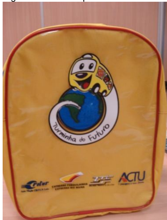
Figura 5 – Mochila personalizada.