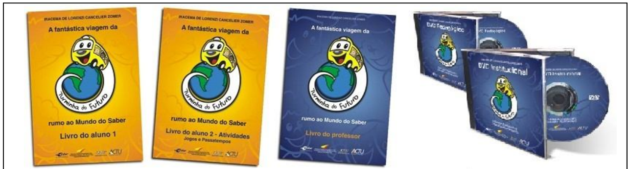
Figura 4 – Material didático.