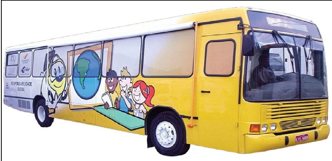
Figura 6 – Ônibus Amarelinho.