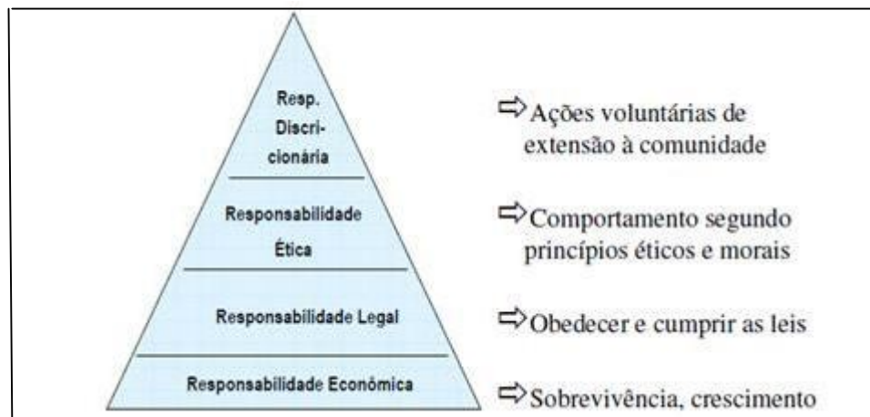
Figura1 – Pirâmide de Carrol

Na Figura 1, a pirâmide de Carrol, ilustra-se: