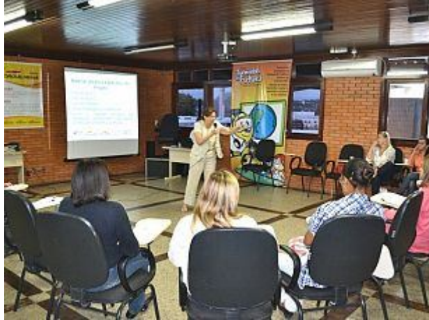
Figura 7 – Capacitação de professores em 2013.