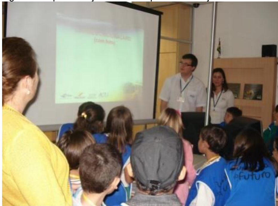
Figura 8 – Apresentação da ACTU para as crianças

Os empresários e seus colaboradores mostram como funciona o escritório, a almoxarifado, o posto de combustível, oficinas, lavação entre outras. São aulas em espaços reais com profissionais que atuam nas empresas e falam de suas tarefas e funções.