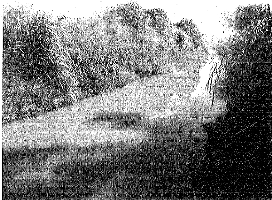
Figura: Ponto de coleta