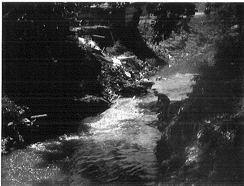
Figura: Ponto de coleta