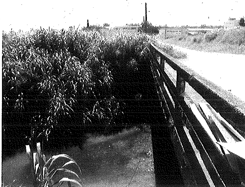
Figura: Ponto de coleta

Data da Coleta: 05/03/12 Data de Entrada: 05/03/12 Período de Execução dos Ensaios: 05/03 a 22/03/2012 Descrição da Amostra: Rio Criciúma Ponto de Coleta: RC 06 Coletores: Rodrigo Bonfante / Patrick Mandeli (IPAT/UNESC) Hora da Coleta: 13:50 Condições climáticas: Tempo bom no instante da coleta, sem chuva nas últimas 24h Vazão (L.s -1 ): 356 Temperatura da amostra (°C): 27,8 Temperatura do ar (°C): 33,0 Código da amostra IPAT/UNESC: Nº 62816