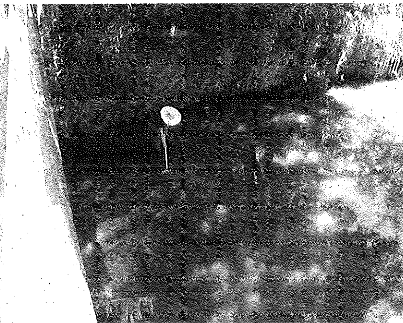
Figura: Ponto de coleta