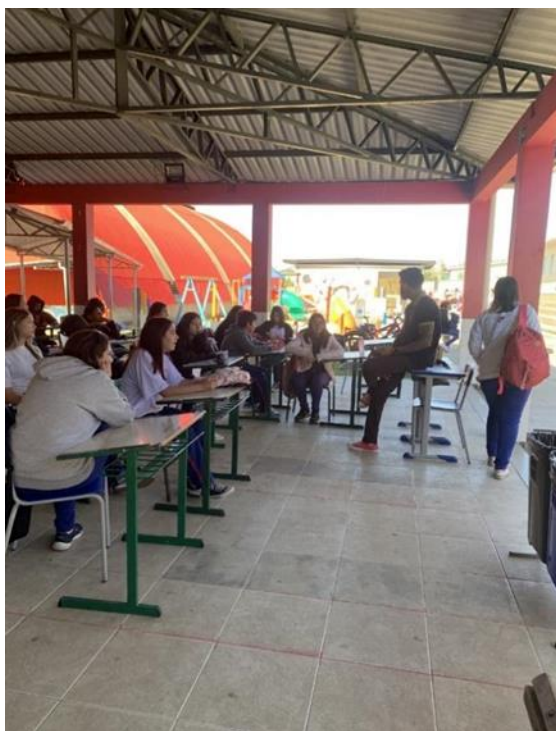
Imagem 2 – Alunos tendo aula na rua