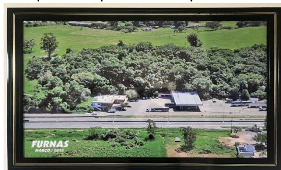
Figura 2 – Imagem do primeiro posto da empresa

Empresa com mais de 50 anos no mercado, sua sede está localizada na cidade de Sombrio, com outras 25 filiais no Rio Grande do Sul e Santa Catarina, a empresa foi herdada pelo pai do atual proprietário, hoje ele está no comando da empresa juntamente com seus filhos auxiliando na gestão.