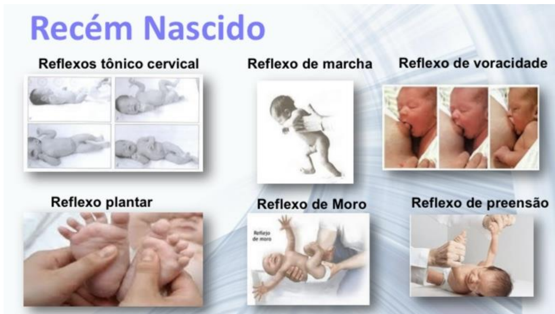
Figura 1: reflexos primitivos do RN: