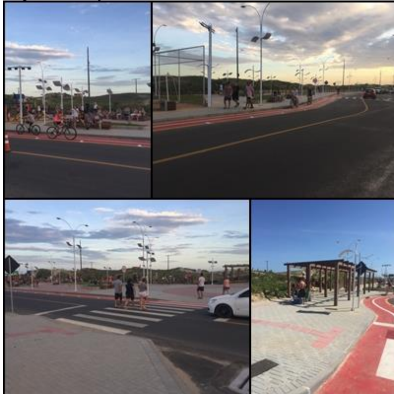
Figura 4 - Calçadão novo construído na beira-mar de Rincão.

Um fato que chamou a atenção foi o número de respostas destacando o calçadão beira-mar como principal ponto positivo do Balneário Rincão.