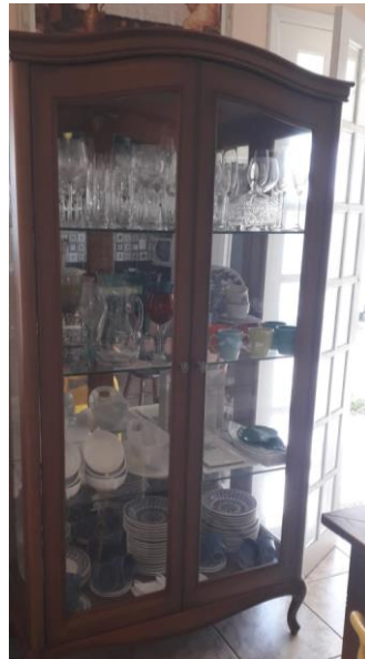
Figura 11 - Cristaleira presente na casa de Marcio.