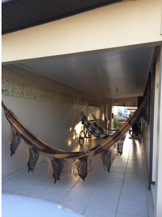
Figura 13 - Garagem com redes para descanso.

Percebe-se a existência de uma preocupação em manter as casas de praia aconchegantes, pensadas para acolher várias pessoas da família e proporcionar hábitos que os moradores acabam não podendo realizar em suas residências primárias.