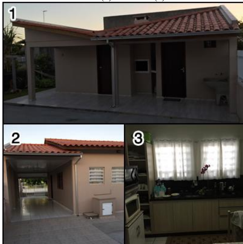
Figura 16 - Fotos retiradas da residência de Paulo: área construída aos fundos (1), fundos da casa (2) e cozinha (3).

A cultura de hábitos mostra mais um ponto importante no processo de apropriação da segunda residência, ainda mais quando se fala em investimentos e ações que não são realizadas em suas casas da cidade, apenas na residência secundária. O conceito de cultura pode ser observado por pequenos indícios durante a pesquisa, e é um grande fator de satisfação dos moradores com suas residências, pois a cultura dos seus espaços possibilita um retorno mais perceptível por eles, como o passatempo da cultura de plantas ou o descanso proporcionado pelas redes, por exemplo.