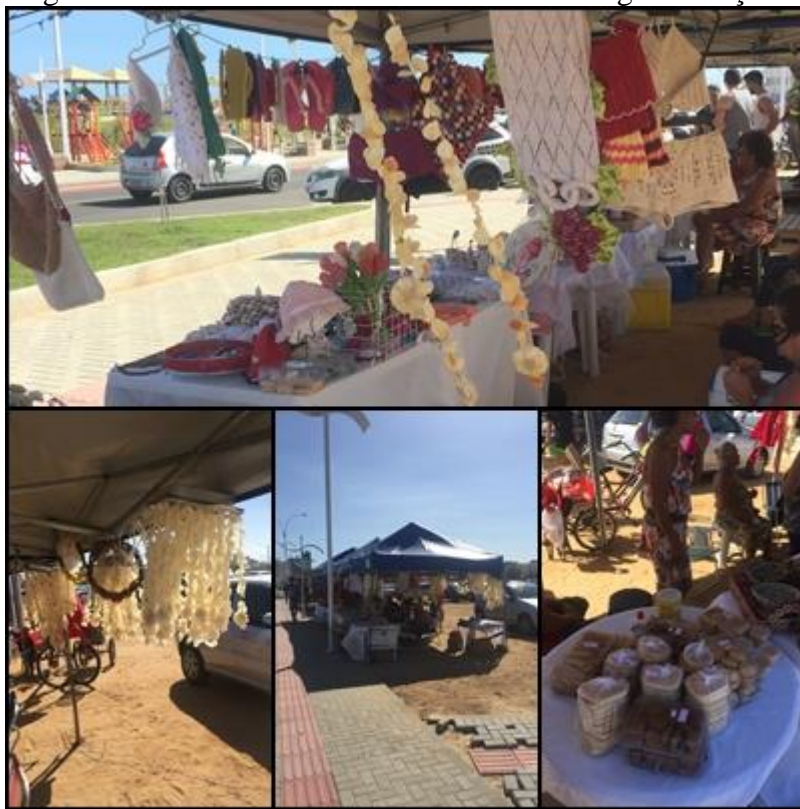
Figura 5 - Tendões de comércio artesanal ao longo da calçada.