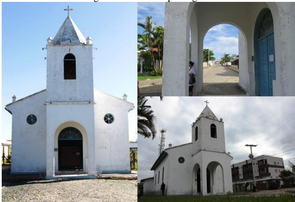
Figura 3 - Museu arqueológico.

Os 13 quilômetros de extensão de praia de Balneário Rincão são divididos em duas partes: zona norte e zona sul, sendo a zona norte a mais antiga e a primeira habitada, e guardando um dos pontos turísticos, que é o museu arqueológico Nossa Senhora dos Navegantes, onde são guardados histórias da humanidade e do homem do Sambaqui. O museu, que antes era uma Igreja Católica, foi inaugurado no ano de 1997 (FERNANDES, 2006).