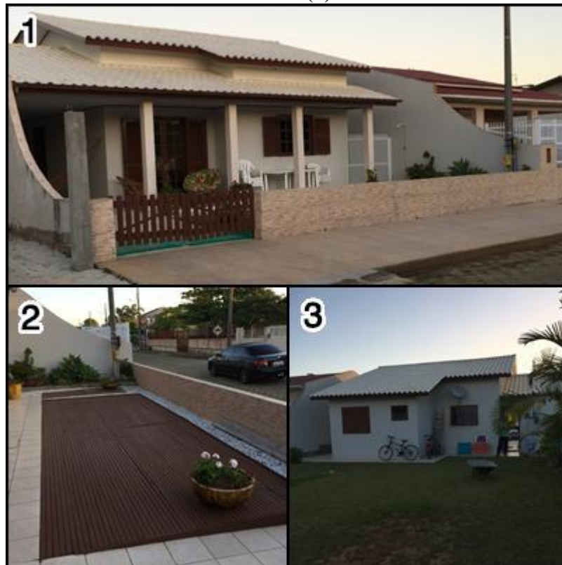
Figura 12 - Fotos retiradas da residência de Marcos: área externa (1), deck (2), pátio aos fundos (3).