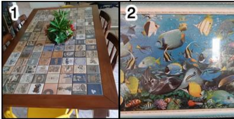
Figura 8 - Objetos de importância encontrados na casa de Marcio: a mesa (1) e o quadro (2) foram feitos por ele.

personificação do local, que acaba tomando a forma desejada pelo morador. A mesa customizada (personalizada a partir de suas preferências) é outro objeto que remete ao mesmo conceito, pois em ambos os casos se tratam de decorações com alta carga simbólica. Dessa maneira, os objetos contribuem para a construção de um ambiente satisfatório emocionalmente.