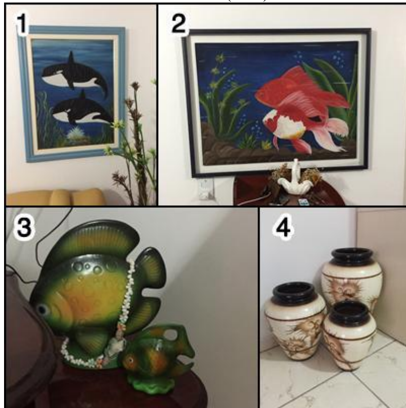
Figura 10 - Decorações presentes por toda a casa de Gorete: quadros litorâneos (1 e 2) e peças de cerâmica (3 e 4).