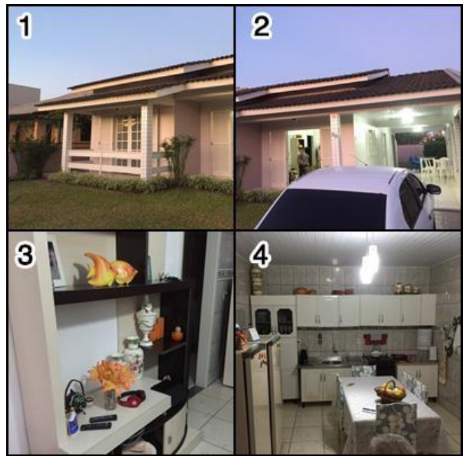
Figura 7 - Fotos da residência de Gorete: área externa (1), garagem e área de lazer (2), estante da sala (3) e cozinha (4).

uma residência com bastante espaço externo para o lazer [Figura 7 (1 e 2)], com uma sacada no quarto da frente de frente para o gramado, e a garagem com cadeiras, que leva ao pátio dos fundos. Trata-se de uma residência na qual se observa a presença das portas abertas, que remetem diretamente ao relacionamento dos indivíduos residentes com as pessoas de fora, dando um ar de boas-vindas, como afirmam Günther, Pinheiro e Guzzo (2004). Internamente, observa-se a presença de várias decorações, na estante (imagem 3) e na cozinha [Figura 7 (3)], como vasos de flores, potes de cerâmica e porta-retratos que foram trazidos por ela de sua casa de Criciúma.