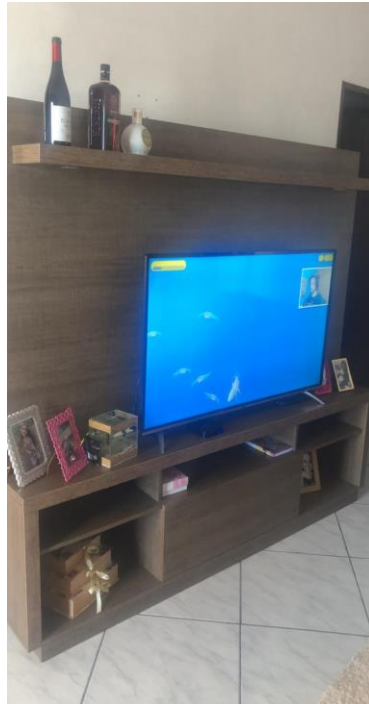
Figura 9 - Fotos da estante presente na sala de João.