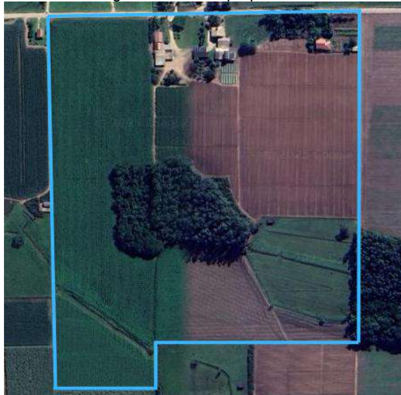
Figura 1: Área da propriedade