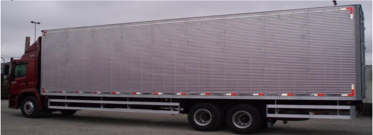
Figura 5 – Caminhão baú.