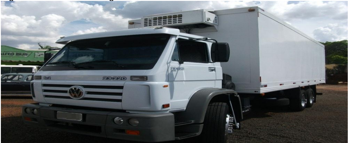
Figura 10 - Caminhão refrigerado.