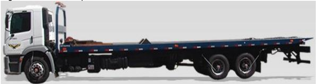
Figura 4 – Caminhão plataforma.