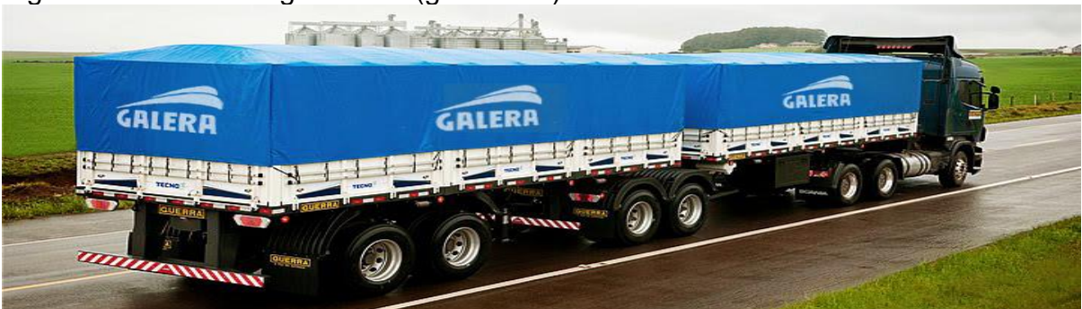
Figura 9 – Caminhão graneleiro (grade alta).