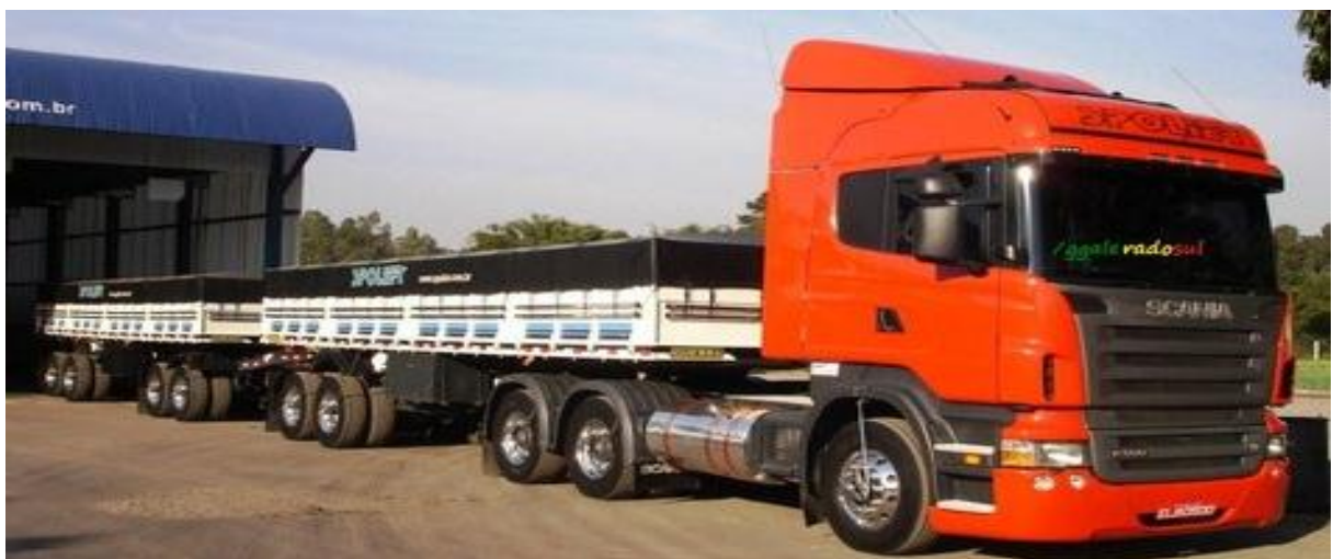
Figura 17 – Rodotrem.