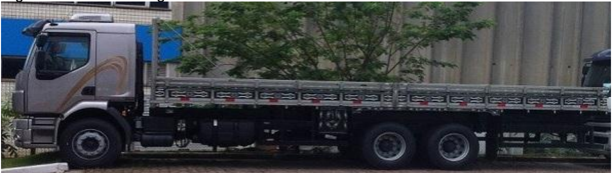
Figura 8 – Caminhão grade baixa.