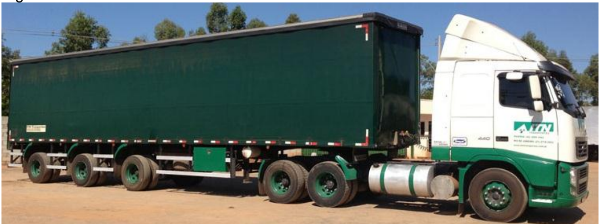
Figura 15 – Carreta vanderleia.