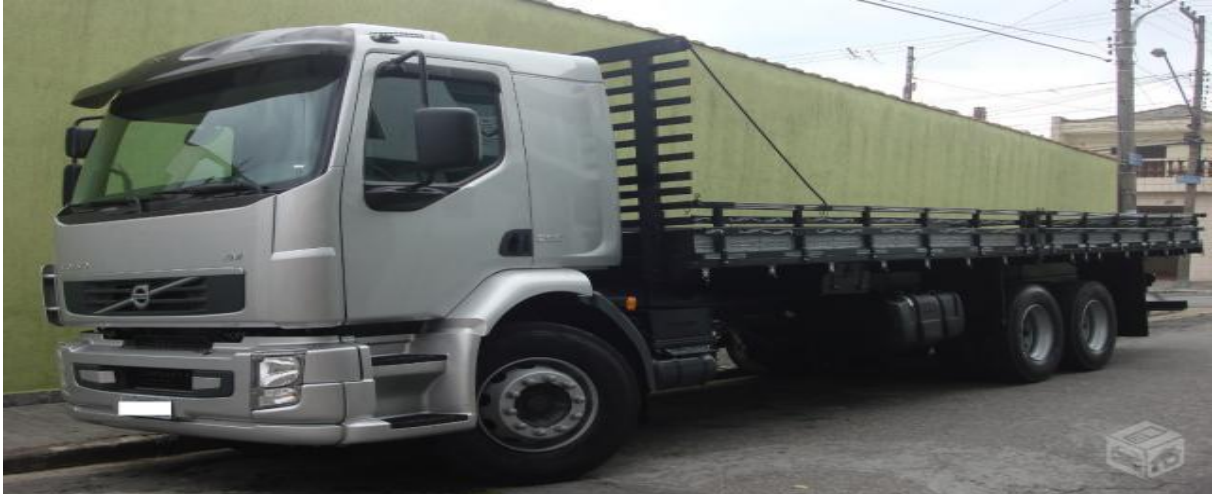
Figura 12 – Caminhão truck.