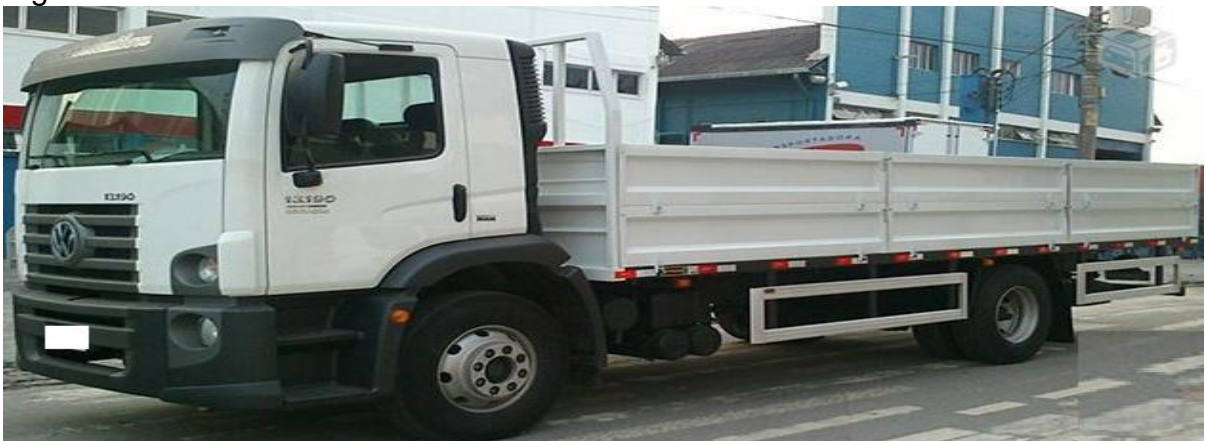
Figura 11 – Caminhão toco.