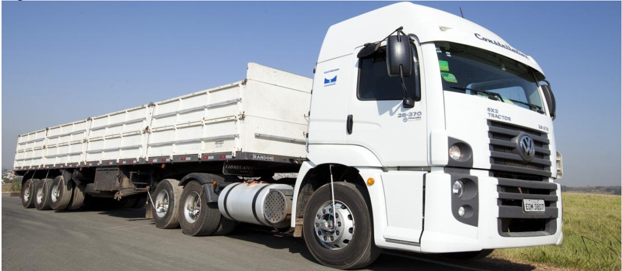
Figura 14 – Carreta trucada.