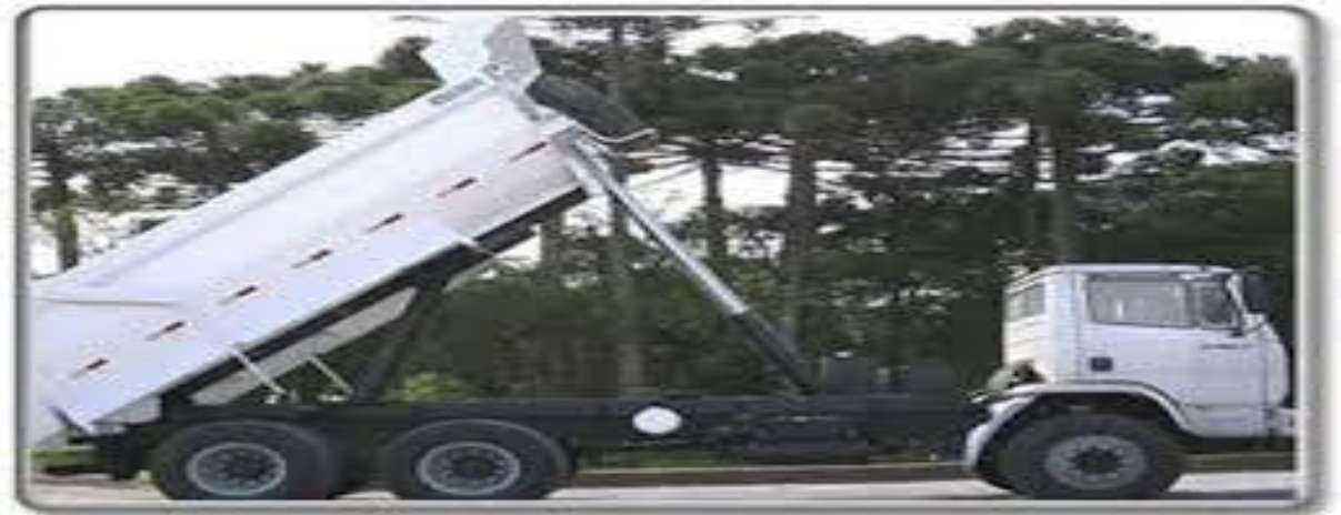
Figura 7 – Caminhão caçamba.