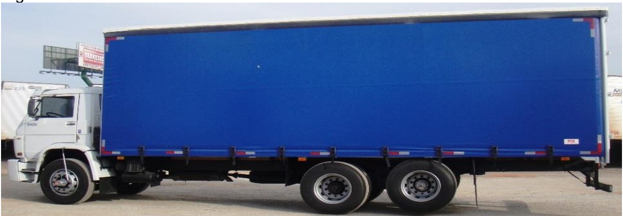
Figura 6 – Caminhão sider.

➤ Caminhão sider: semelhante do baú, porem sua estrutura lateral é de um tipo de lona, podendo ser aberta para carregamento de algumas mercadorias. Transporta grande maioria dos materiais transportados em baú, e também algumas mercadorias paletizadas transportado em grade baixa.