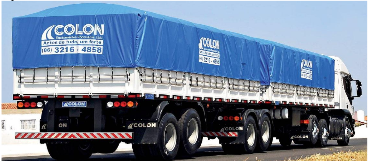
Figura 16 – Bitrem.