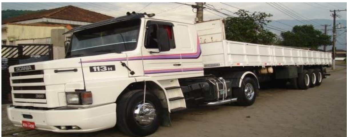
Figura 13 – Carreta simples.