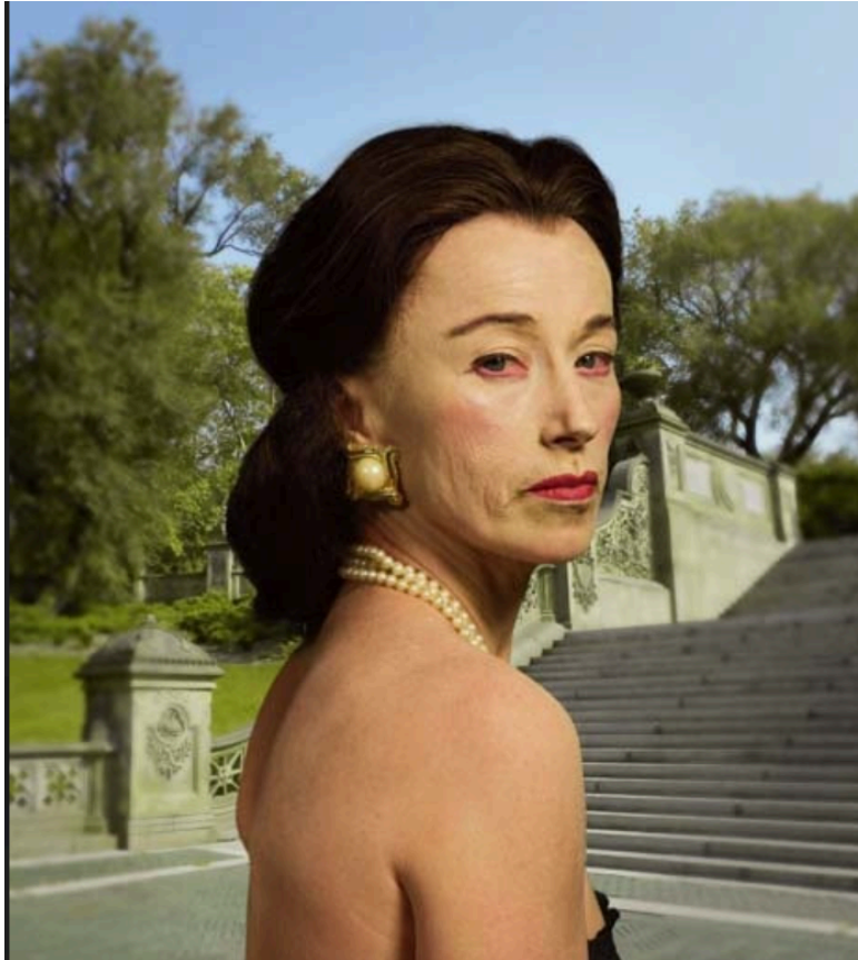
Imagem 6. Sem título #465, 2008, Cindy Sherman.

transformada de diversas formas. Ela explora papéis e estereótipos relacionados à identidade e gênero, representando a construção social da realidade.