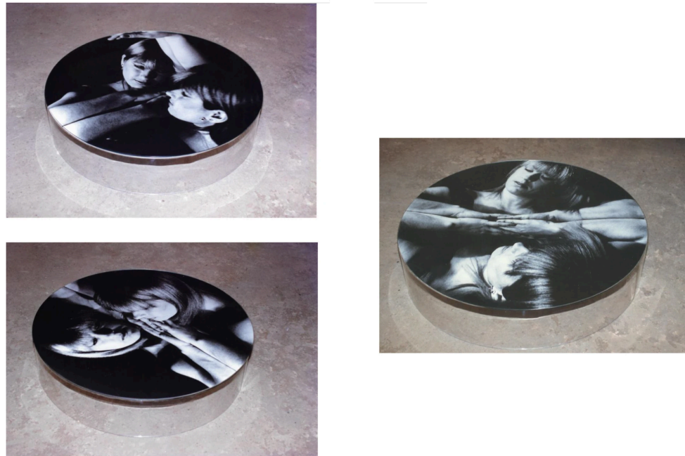
Imagem 10. Reflexos, Lourdes Colombo, 1998.

auto-reflexivo dos papéis devotados à mulher em diferentes tempos, culturas e situações cotidianas que a artista retira a matéria-prima para sua obra.” (Katia Canton, 2001, p.67).