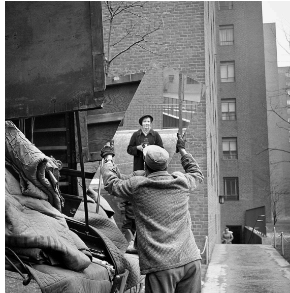
Imagem 8. Auto-retrato, 1955, Vivian Maier.

Vivian Maier (1926-2009) nasceu em Nova York, mas passou parte de sua infância na França e retornou aos EUA na adolescência. Maier trabalhou grande parte de sua vida como babá, em seu tempo livre fotografava as ruas de Chicago até por volta de 1990, produzindo mais de 100.000 negativos. As fotos de Maier podem ser caracterizadas como fotografia de rua, onde captura cenas cotidianas a sua volta, ela tem inúmeros autorretratos, onde através de espelhos e vitrines ela se fotografava e a seu redor ao mesmo tempo.