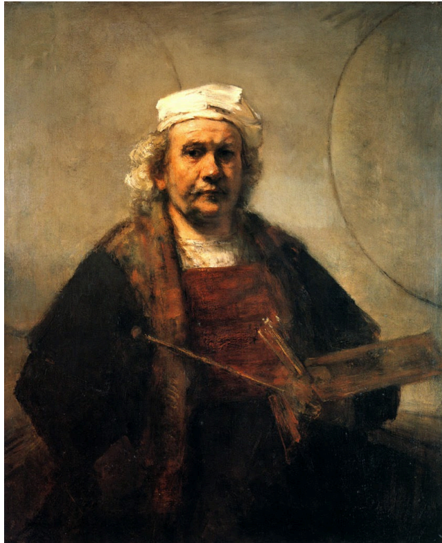
Imagem 5. Autorretrato com Dois Círculos, Rembrandt, c. 1665-1669.

Um de seus famosos trabalhos é o "Auto-retrato jovem" é um dos primeiros autorretratos do artista, por volta dos 23 anos. O jovem artista está curvado enquanto se apresenta com uma expressão séria, quase misteriosa, parcialmente imerso na escuridão, enquanto uma luz ilumina um lado de seu rosto.