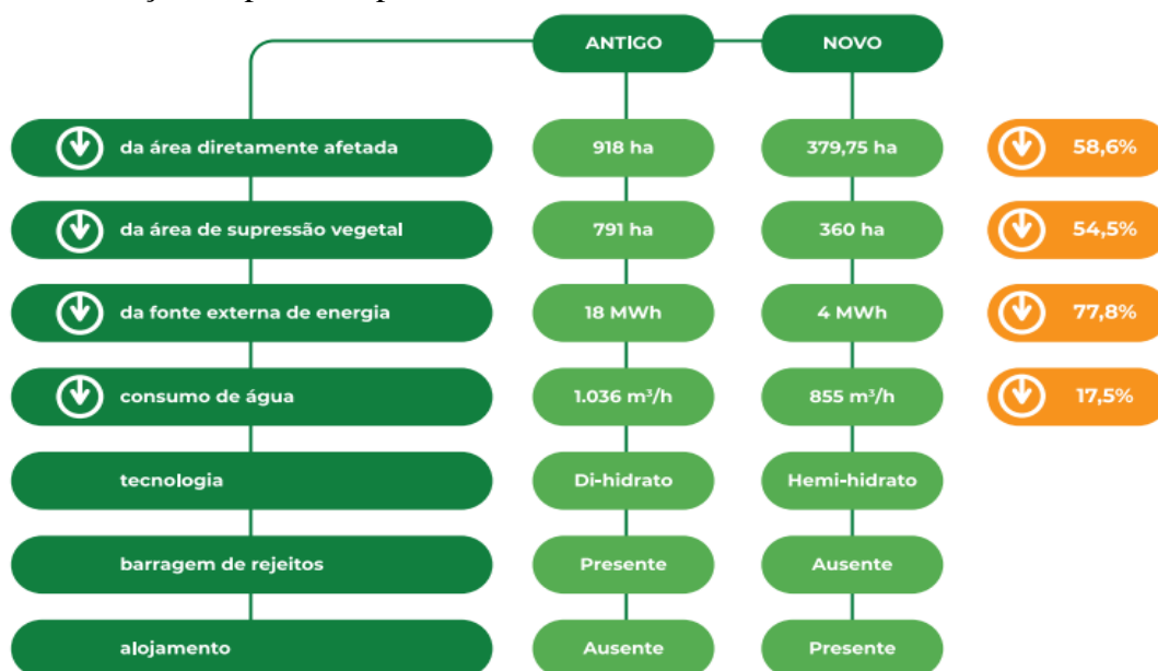
Figura 4 - Evolução do processo produtivo

Considerando algumas inovações de processos de separação do minério e no reuso dos recursos hídricos, a licença prévia do PSQ está novamente em análise, tendo como ponto positivo as evoluções no processo produtivo, que agora propõem uma nova técnica de separação do minério a seco, denominada de “calcinação”, dentre outras modificações resumidas na figura abaixo, contida entre as complementações produzidas pelo empreendedor. Vejamos: