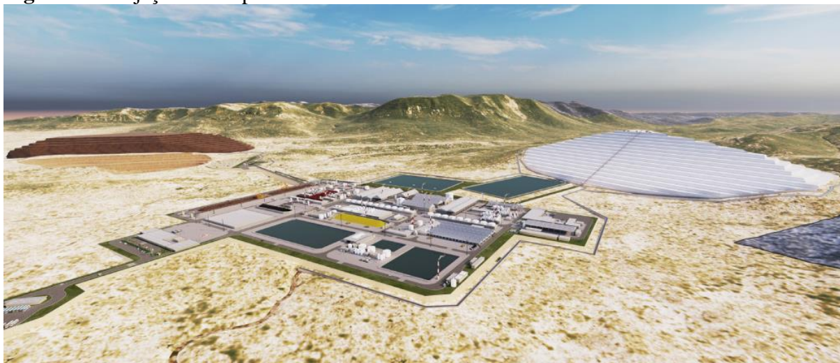
Figura 3 - Projeção do empreendimento