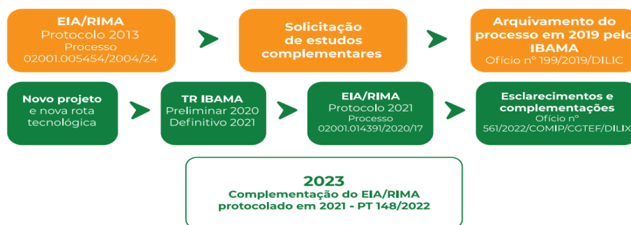
Figura 1 - Fluxograma dos processos de licenciamento ambiental.

(Figura 1) a seguir ilustra a sequência de análises recentes da licença prévia do projeto.