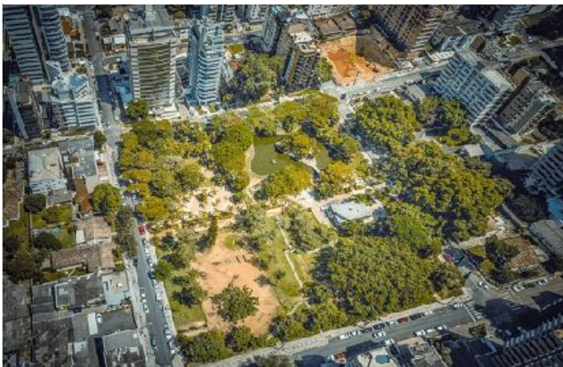
Figura 16 - Praça do Congresso em 2019