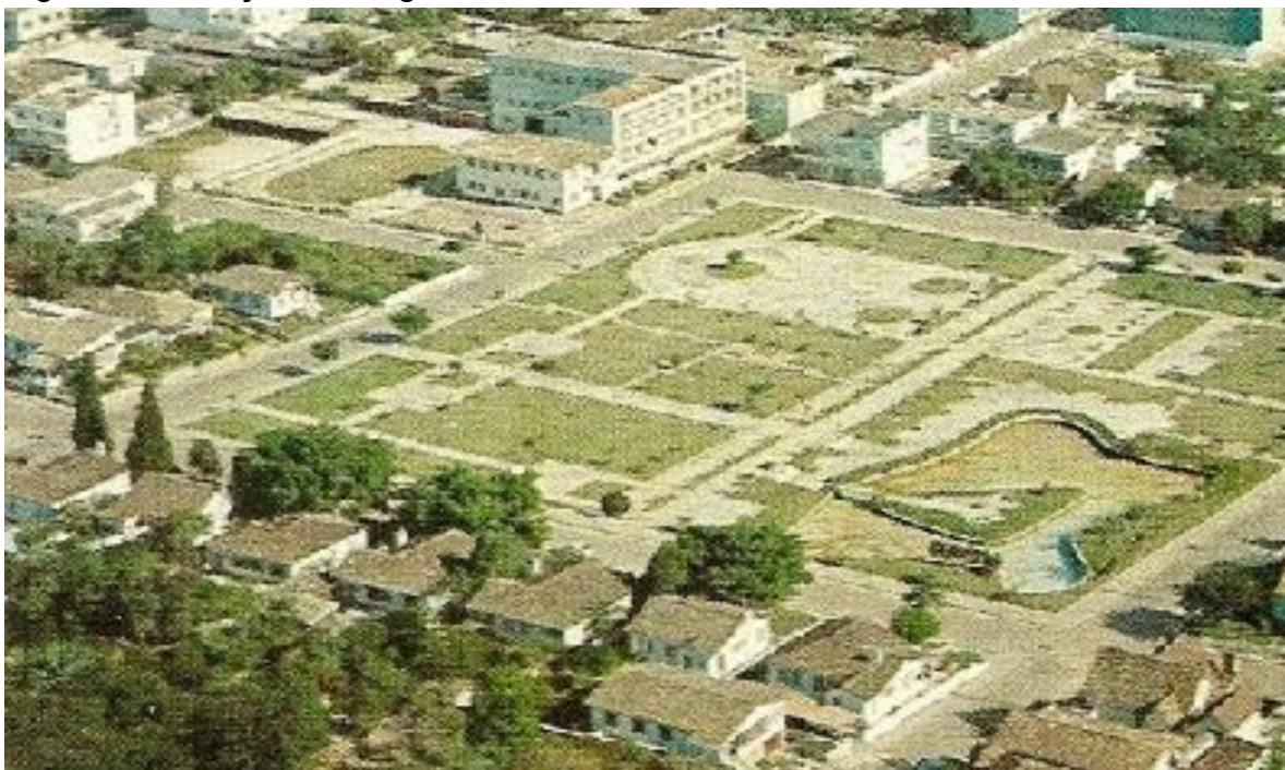
Figura 15 - Praça do Congresso em 1970