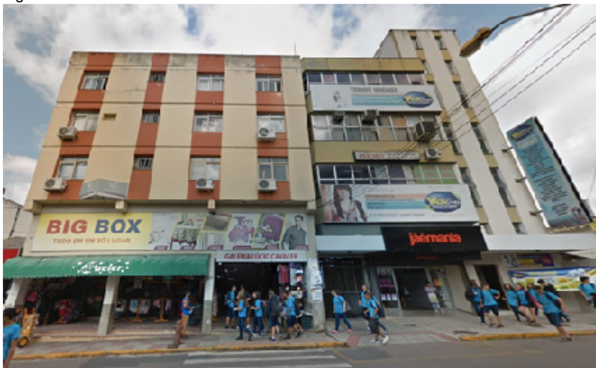
Figura 2 - Galeria Lúcio Cavaller