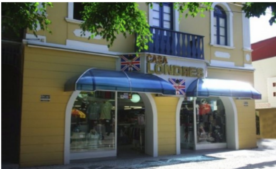
Figura 10 - Casa Londres (Empório Benedet)