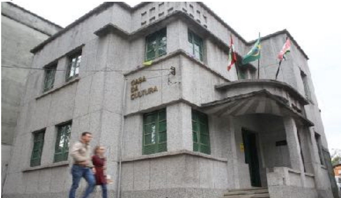
Figura 11 - Casa da Cultura Neusa Vieira