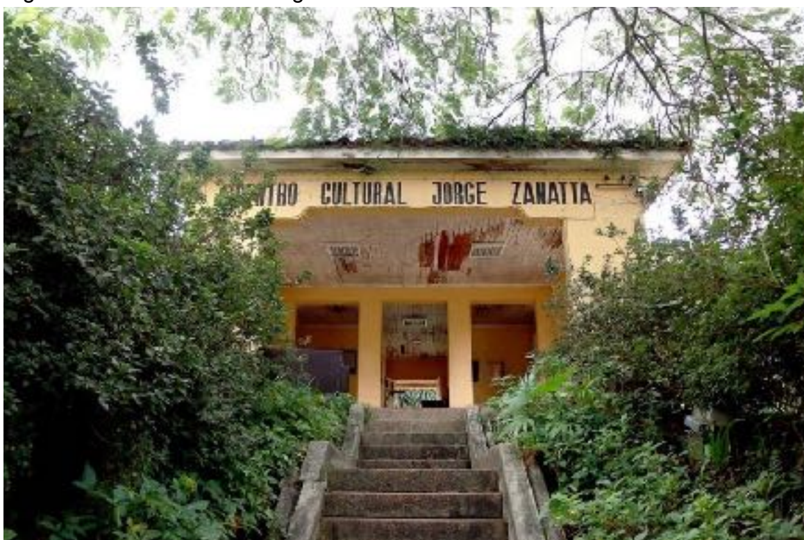
Figura 9 - Centro Cultural Jorge Zanatta

Dentre a longa listagem de bens integrantes do PIC o Centro Cultural Jorge Zanatta, localizado na rua Coronel Pedro Benedit, nº 225-333, Centro de Criciúma/SC fez parte desses bens que foram tombados através do Decreto de nº 816/SA/2003 e 940/SA/2007, devido a sua importância histórica local. Nascimento et al. (2003, p. 85) relata um pouco da história do referido imóvel, salientando que o mesmo foi edificado no ano de 1940 para o funcionamento do Departamento Nacional de Produção Mineral (Figura 9). A estrutura arquitetônica do prédio demonstra um período grandioso da indústria carbonífera catarinense, decorrente da 2ª Guerra Mundial e da criação da Companhia Siderúrgica em 1946. Conforme o autor, a partir desse ano Criciúma começou a se destacar no cenário econômico brasileiro, recebendo o título de “Capital Brasileira do Carvão”.