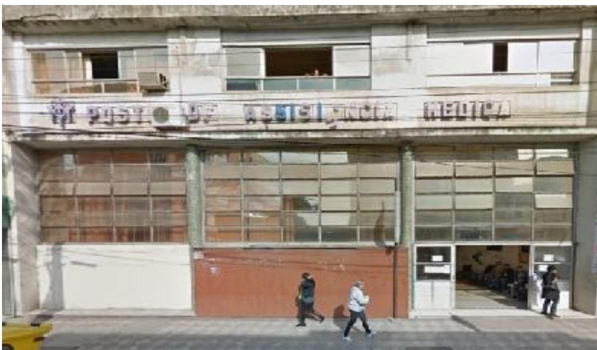
Figura 8 - Prédio do INPS