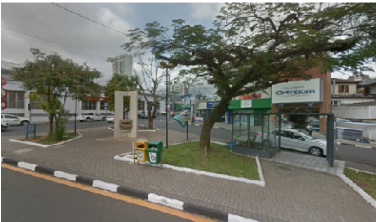
Figura 17- Praça do Imigrante 2017