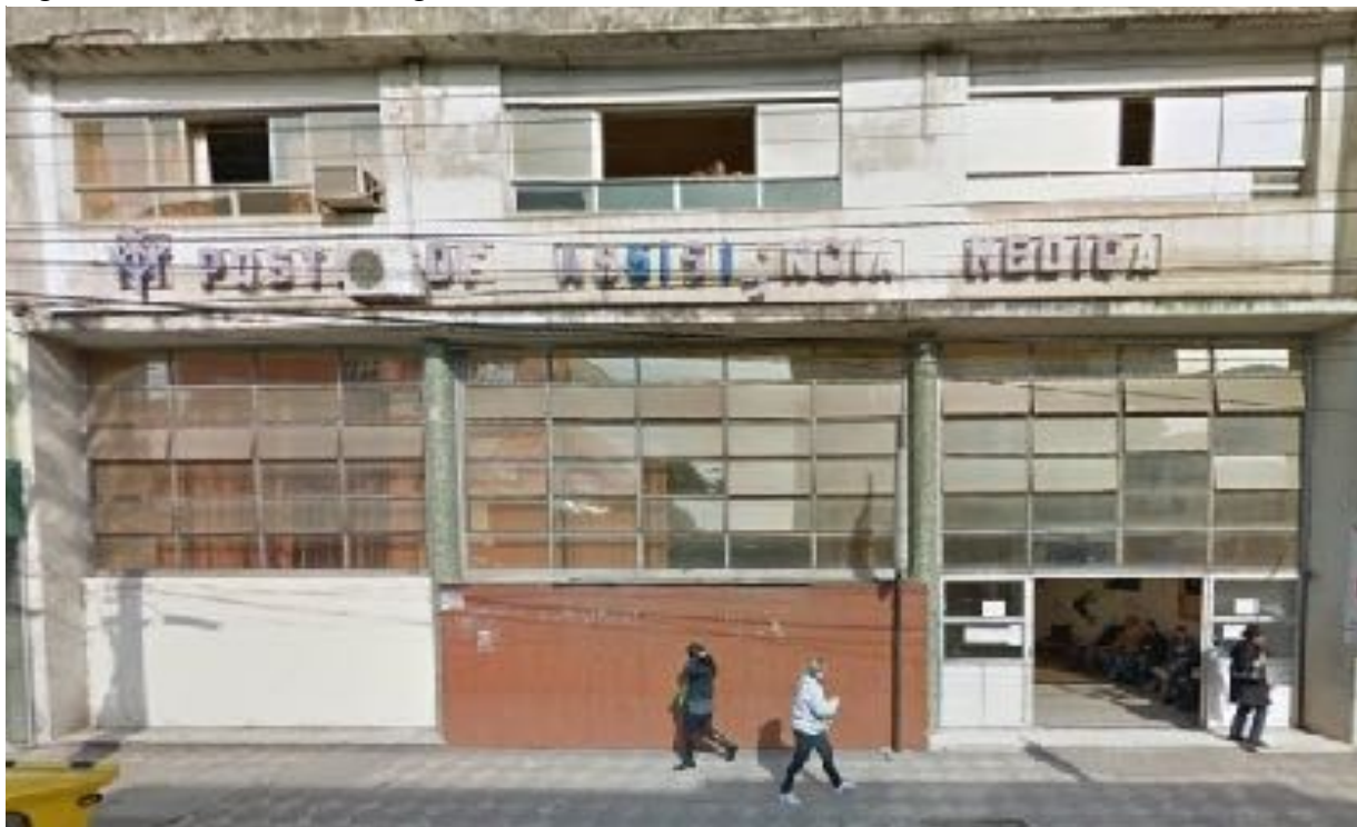
Figura 19 - Prédio do Antigo INPS