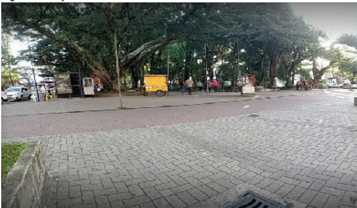
Figura 7 - Praça Nereu Ramos