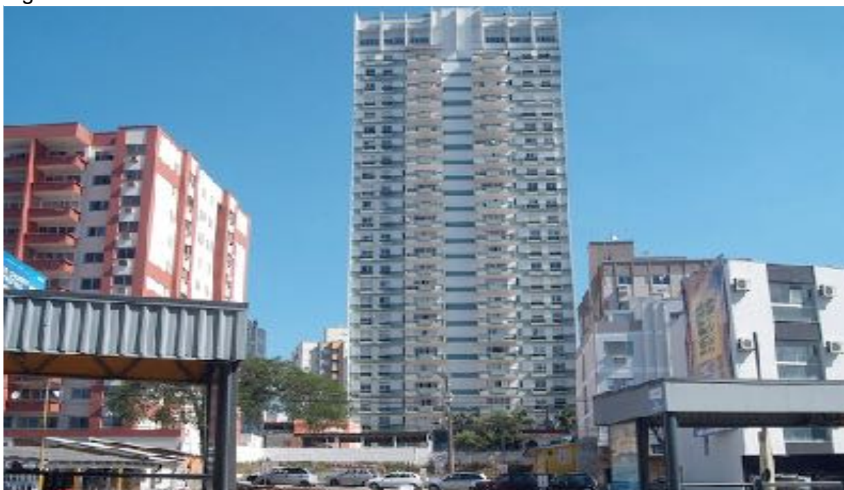
Figura 1 - Edifício Lúcio Cavaller

O Edifício Lúcio Cavaller (Figura 1), localizado na rua Cecília Darós Casagrande, bairro Comerciário, nº 150, Criciúma/SC foi construído no ano de 1968, sendo edificado 36 apartamentos distribuídos em quatro apartamentos por pavimento. No momento da construção se tentava imprimir uma marca de modernidade a cidade, a fim de incorporar no imaginário da população de Criciúma que a cidade está em constante desenvolvimento (NASCIMENTO et al. , 2003, p. 39).