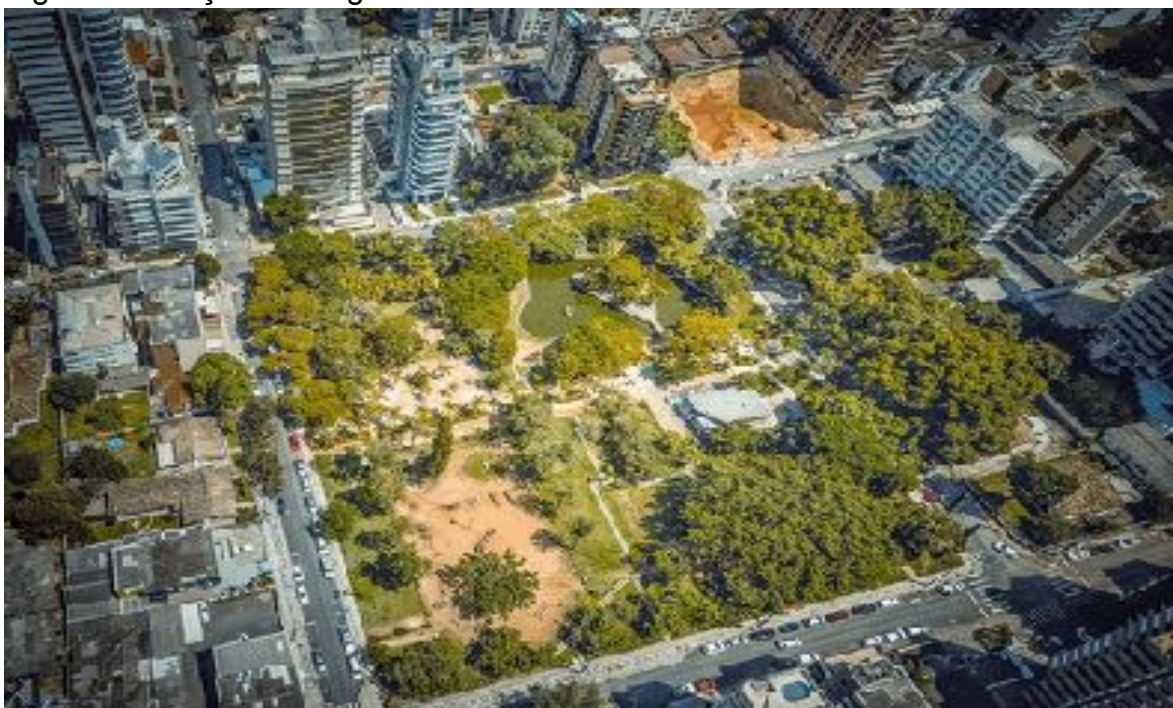
Figura 4 - Praça do Congresso

A Praça do Congresso (Figura 4), localizada na rua Lauro Müller, no Centro de Criciúma/SC foi inaugurada em 1968 na semana da criança tendo em vista que a praça era destinada a esse público, também sendo procuradas para caminhadas e exercícios físicos. A Praça do Congresso é um patrimônio histórico, não apenas por ser uma das praças mais visitadas da cidade, também porque constitui lembranças e troca de práticas sociais e culturais para diversos e múltiplos agentes (NASCIMENTO et al. , 2003, p. 50-53).