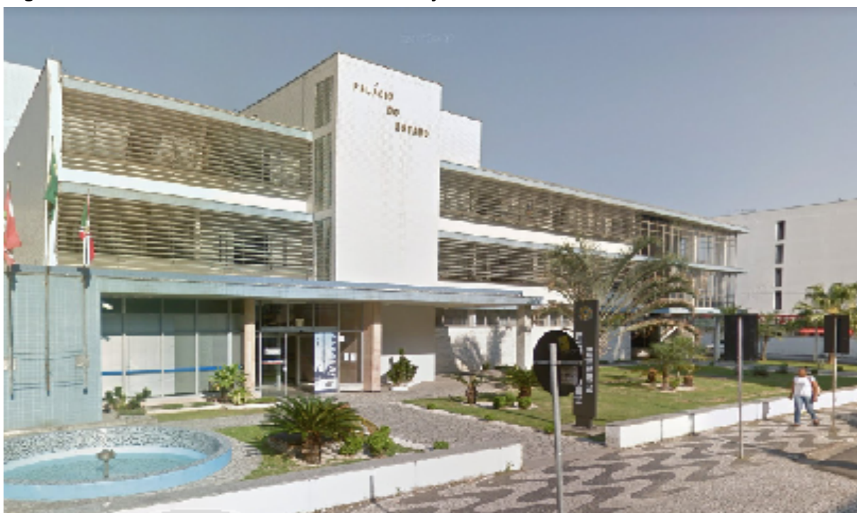
Figura 3 - Palácio do Estado John Kennedy