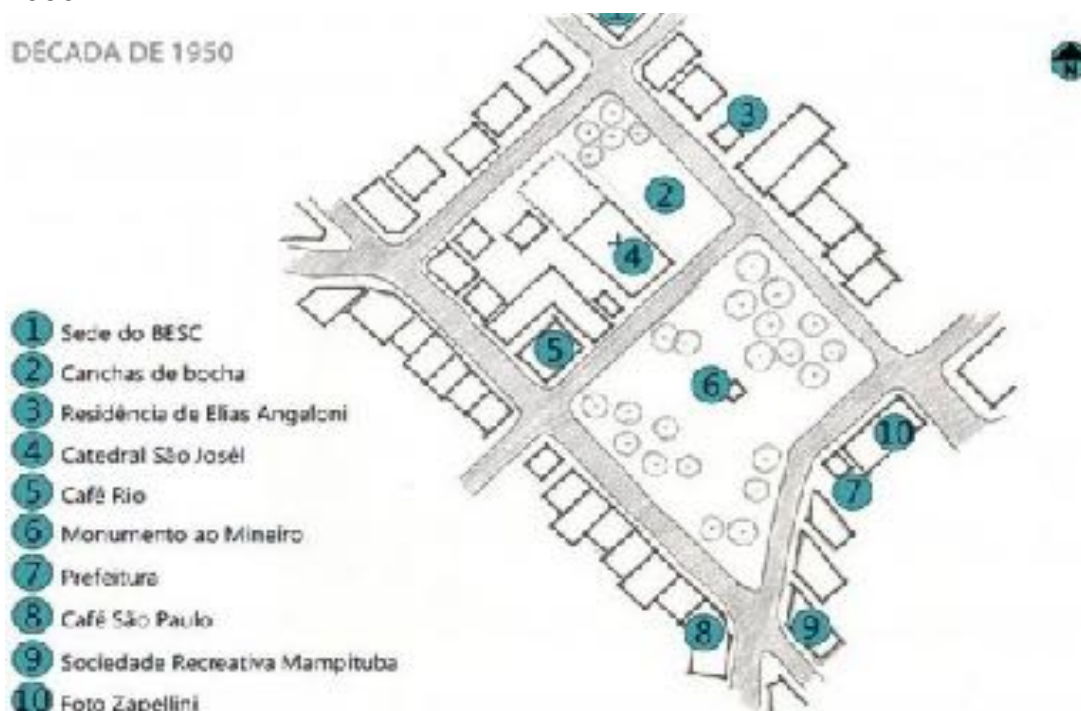
Figura 13 - Croqui da Praça Nereu Ramos e seu entorno imediato em 1950