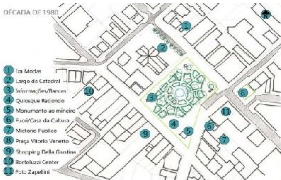
Figura 14 - Croqui da Praça Nereu Ramos e seu entorno imediato em 1980