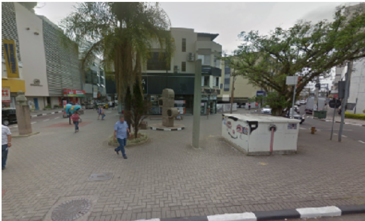
Figura 5 - Praça do Imigrante e seu Monumento