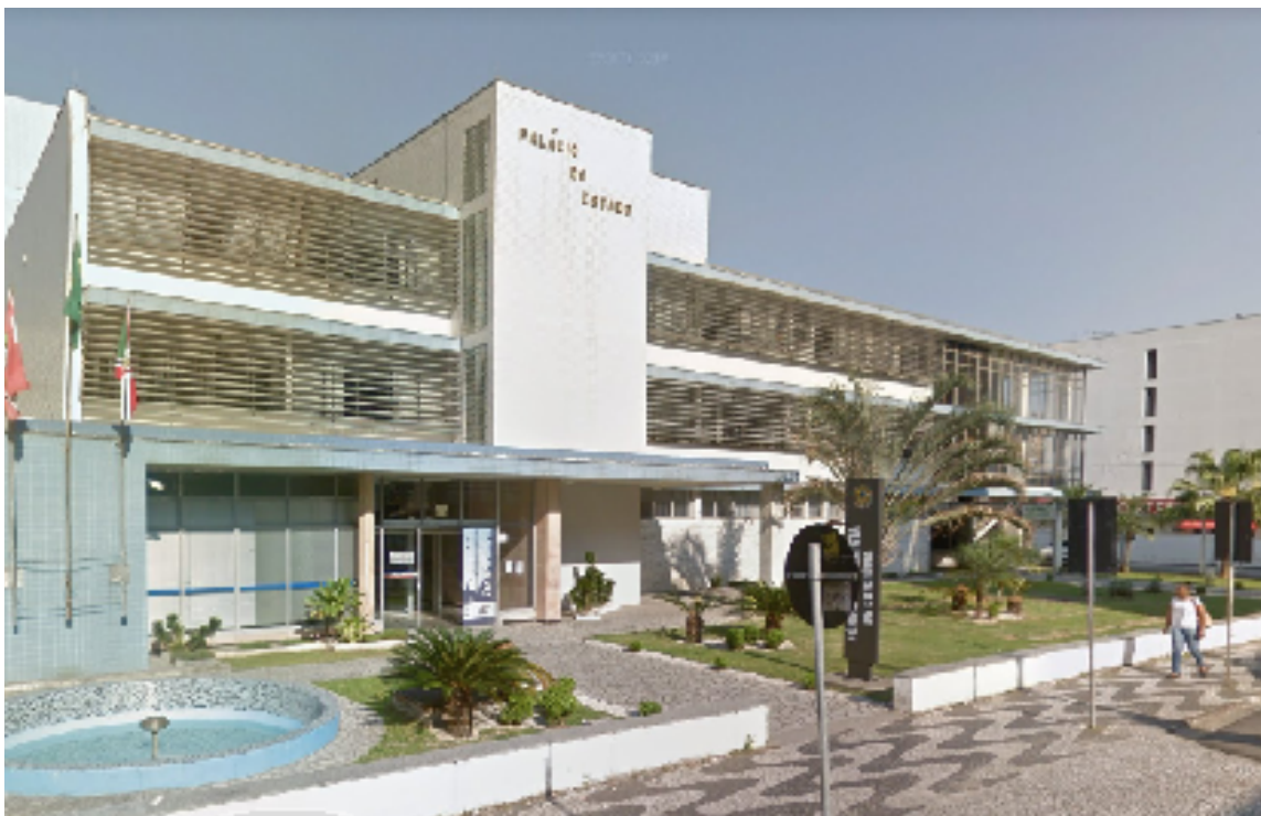
Figura 18 - Antigo Palácio do Estado John Keneddy