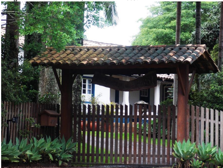
Imagem 10 - Casa V6 Justi, tombada em 2003.