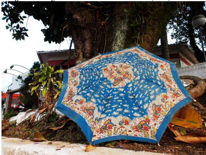
Imagem 6 - Imagem afetiva da minha sombrinha (2019).

Desde aquele dia eu senti vergonha de usá-la, a sombrinha ficou pequena para o meu corpo de criança, mas significativa o suficiente para caber entre os meus objetos biográficos.