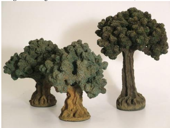
Imagem 3 - Megumi Yuasa. Escultura “Árvores”, S/d.