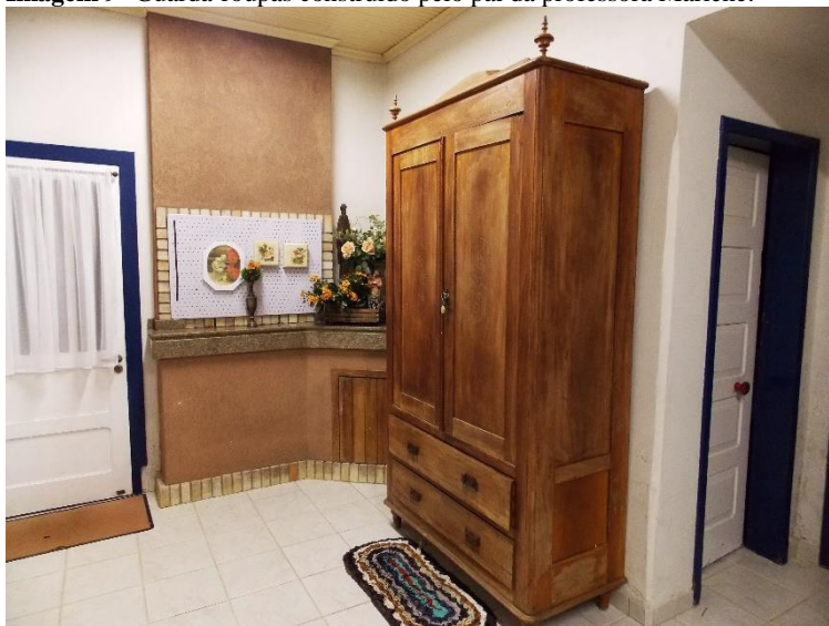
Imagem 9 - Guarda-roupas construído pelo pai da professora Marlene.