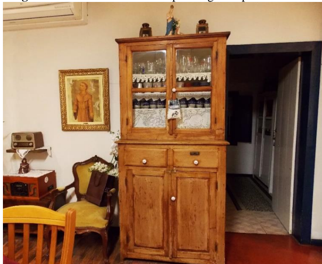
Imagem 8 - Cristaleira construída pelo sogro da professora Marlene.