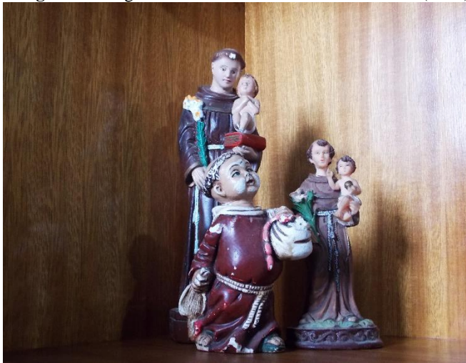
Imagem 5 - Imagem afetiva da estátua de Santo Antônio (2019).