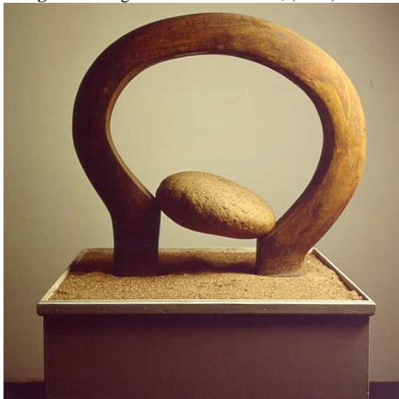
Imagem 4 - Megumi Yuasa . Semente, (1975).