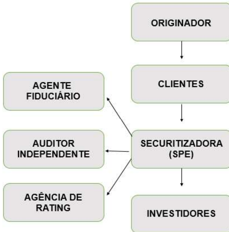
Figura 2 - Fluxo operacional de uma securitização.

Fonte: Adaptado de Forno e Sessim (2014).