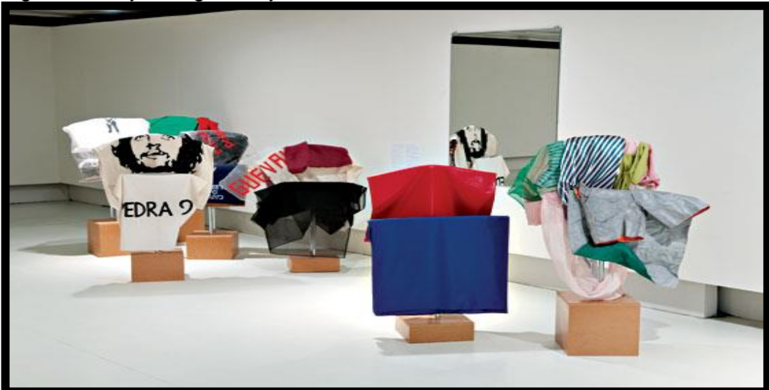
Figura 5 - Seja marginal seja herói.