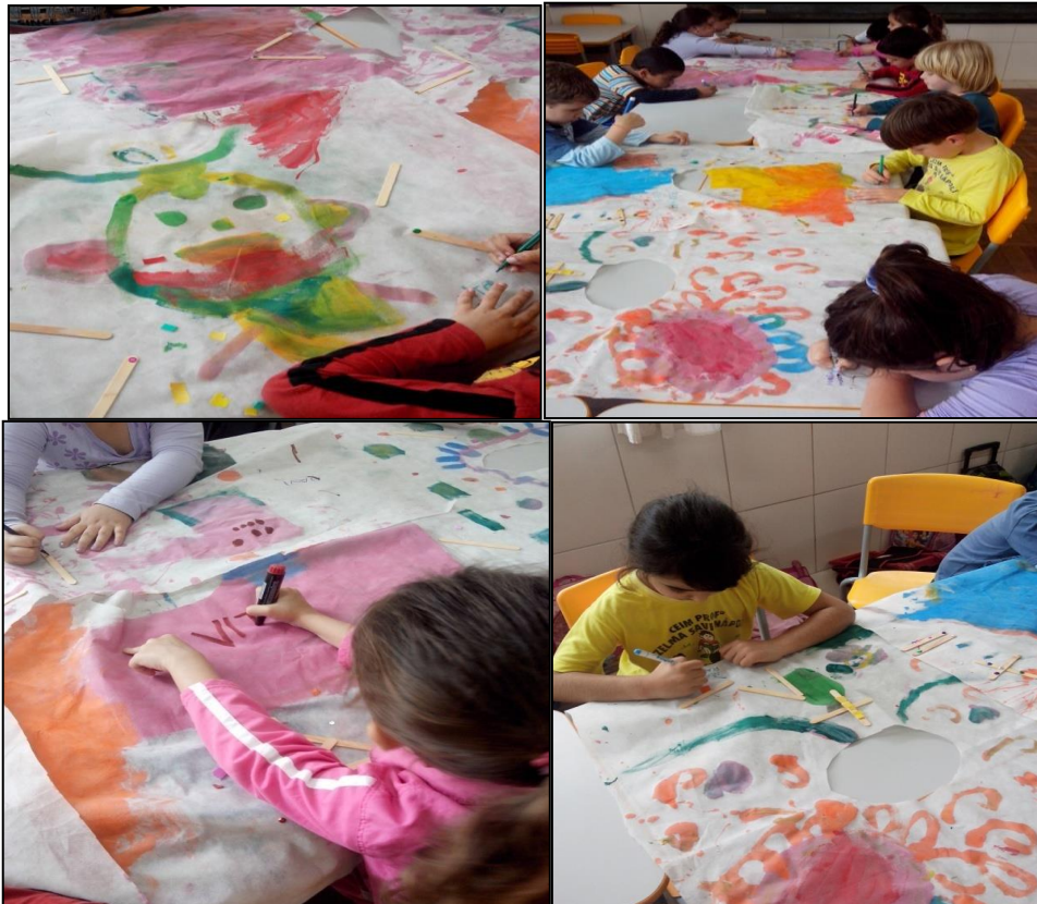
Figura 14 - Escrevendo nomes nas capas.

resultado foi gratificante, pois, elas quiseram colocar os nomes dos colegas e até de algumas pessoas da família. Esta claro que elas se doam de corpo e alma quando estão produzindo algo, sobre isso argumenta Barbieri (2012, p. 21) “entregam-se por inteiro, pois é a coisa mais importante que elas têm a fazer naquele instante.”