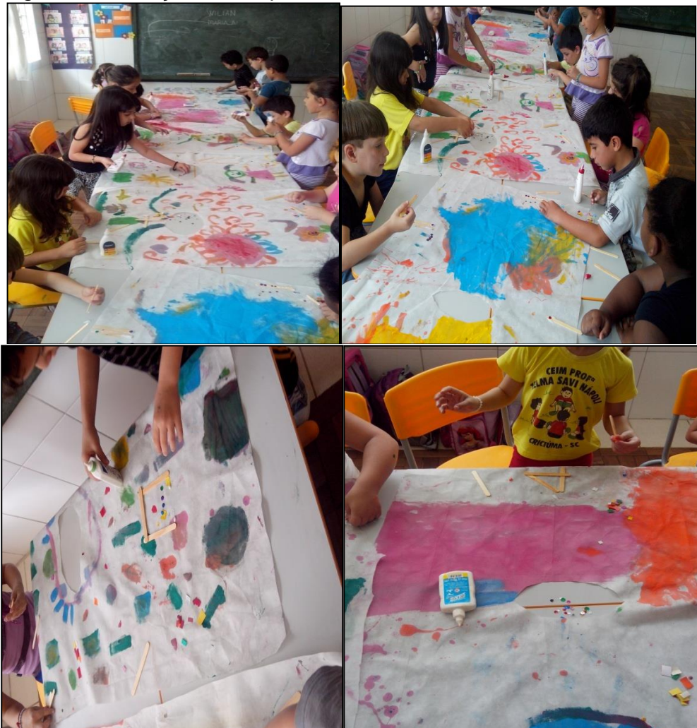
Figura 13 - Criação das capas.

Comunicação feita sobre o Bispo do Rozario fiz a proposta aos alunos de construir suas próprias capas. Empolgados em criar e demonstrando interesse expressando no rosto toda a ansiedade de começar logo a produção. Ao entregar os materiais disse às crianças que eles tinham total liberdade para colocar na capa a cor que quisessem utilizar. Disponibilizei palitos, lantejoulas, guache, lápis, canetinhas, botões e tampinhas. Barbieri (2012, p. 43) ressalta ao falar da produção da criança “as produções da criança, são como obras dos artistas possibilita trocas de percepções, ideias, informações e conhecimento.”