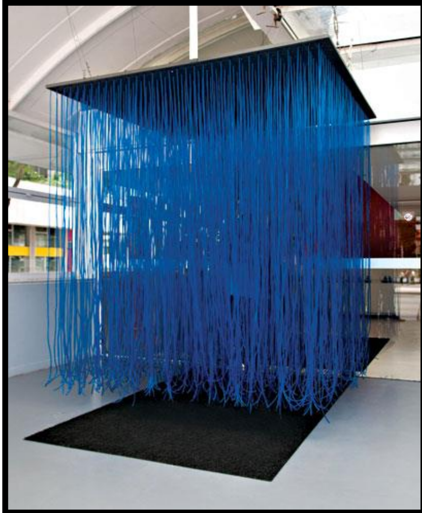
Figura 6 - Penetrável da Gal.