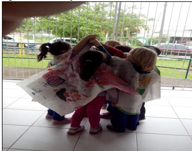
Figura 16 - Crianças brincando.

No pátio da escola elas correram livremente, brincaram, se envolveram, tornaram-se parte da obra. Elas nem se preocuparam em mostrar a capa ou exibi-la simplesmente viveram o momento brincando. Acrescenta Cohen (2002, p. 45) “performance é basicamente uma linguagem de experimentação, sem compromissos com a mídia, nem com a expectativa de público e nem com ideologia engajada.” O Parangolé não era assim uma coisa para ser posta no corpo, para ser exibida. A experiência da pessoa que veste, ou das que vestem simultaneamente as coisas, são experiências simultâneas, são multe experiências. “Não se trata, assim, do corpo como suporte da obra; pelo contrário, é a total ‘in(corpo)ração’.” (OITICICA, 1985, p. 48 apud FAVARETO 2000, p. 107).