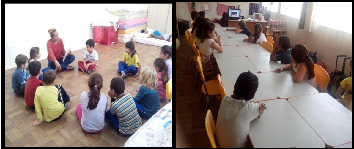
Figura 12 - Apresentação da performance e do artista.