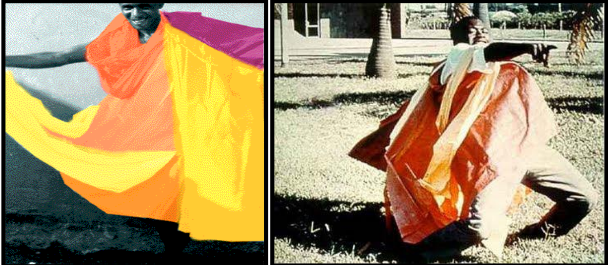
Figura 9 - Parangolé.