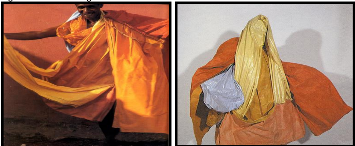
Figura 8 – Os Parangolés.