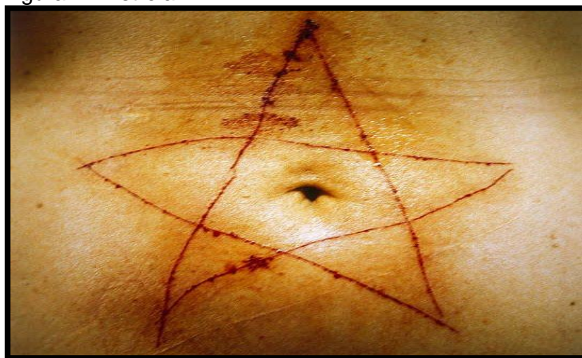
Figura 2 - Estrela