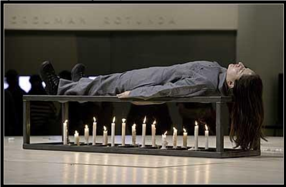
Figura 1 - The conditioning - Autoportrait.