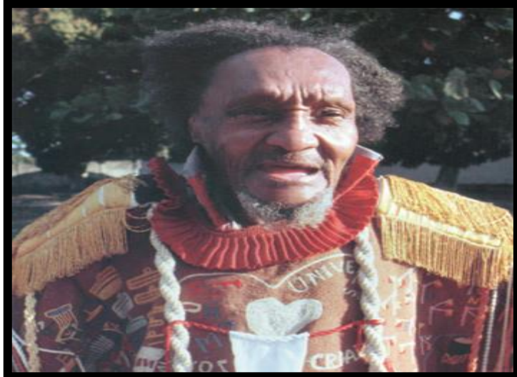
Figura 10 - Arthur Bispo do Rosário.