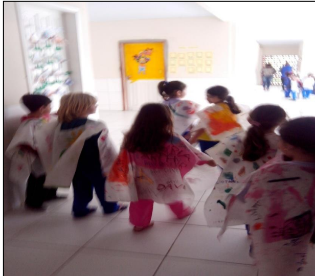
Figura 15 - Fazendo a performance Parangolé.