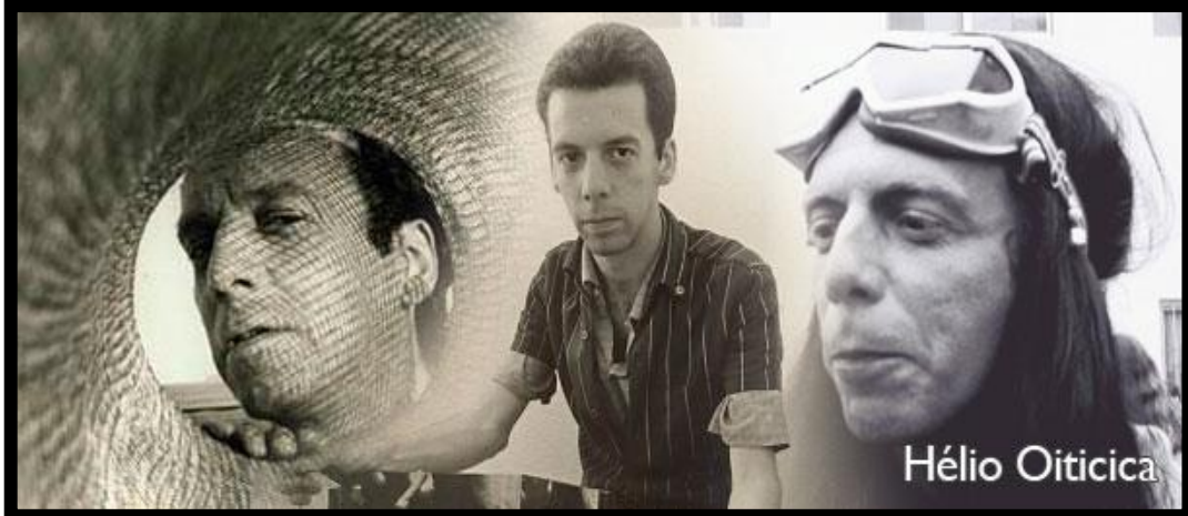
Figura 3 - Hélio Oiticica.