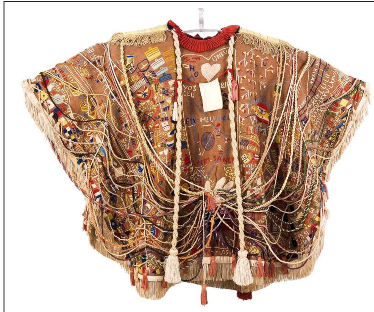
Figura 11 - Manto da apresentação.