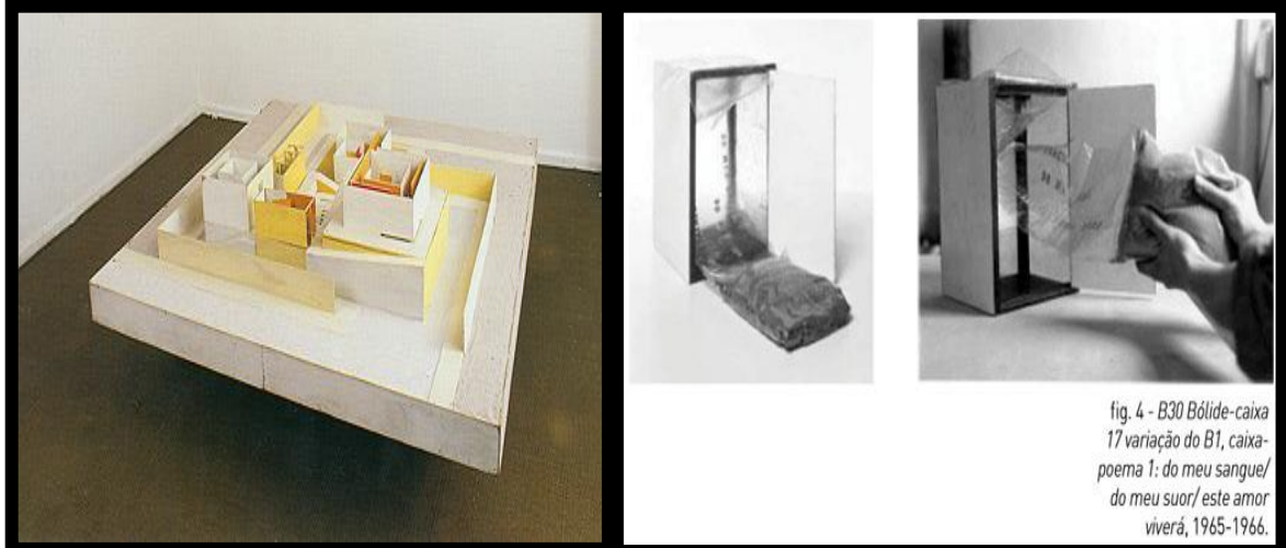
Figura 7 - Bólides que são estruturas manuseáveis chamados de B1 Bolide caixa 1.