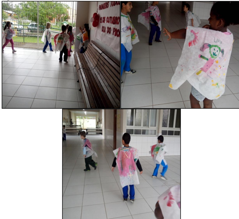
Figura 17 - Capas.

Quando a criança brinca, ela se expressa de várias maneiras, pois ela não se prende a outras coisas, quando está brincando. Ao passo que Barbieri (2012, p. 32) coloca que, “quando está brincando, elas não estão pensando em outra coisa, elas estão fazendo e pensando, com o corpo presente, de forma presente aqui e agora.” A criança usa o espaço que lhe é fornecido e se entrega por inteiro. Essa turma surpreendeu nesta experiência, pois transmitiram nesta vivência a essência da obra do Bispo do Rozario e de Hélio Oiticica, e envolveram totalmente na produção e utilização das capas.