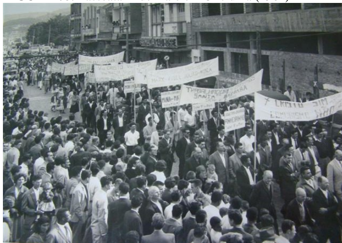
FIGURA 08: Passeata 1º de maio em Criciúma (1962)