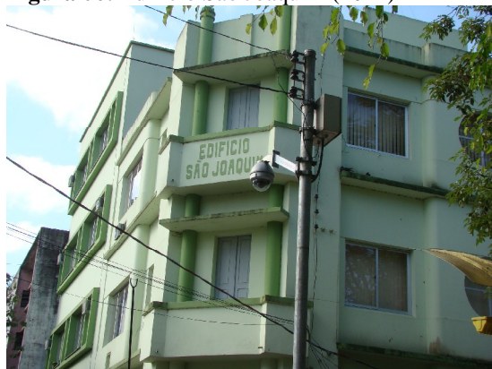
Figura 06: Edifício São Joaquim (2011)