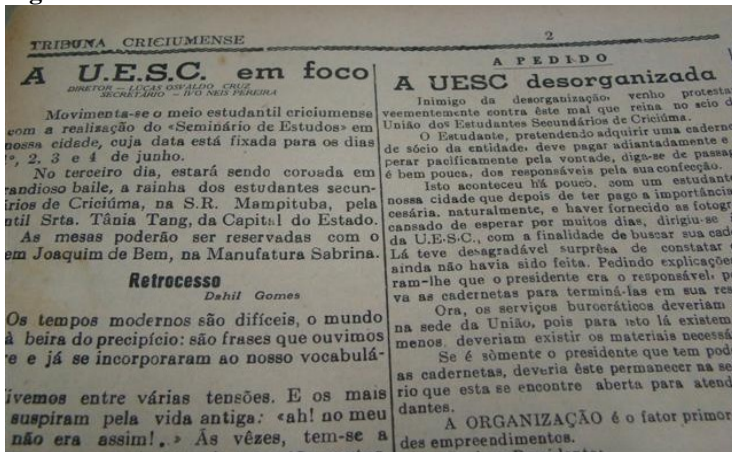
Figura 02: UESC em foco e as críticas