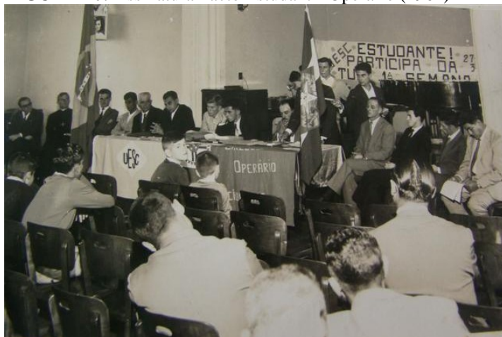
FIGURA 10: Assinatura Pacto Estudantil-Operário (1962)

A proposta do Pacto Estudantil-Operário baseava-se em ajuda mútua entre as partes. Criticavam o custo de vida elevado ao mesmo tempo em que defendiam uma “democracia cristã”. As críticas iam mais longe. Chegavam até a forma proposta pelo governo de João Goulart e pediam “reformas urgentes de base, como a reforma agrária, em bases cristãs e democráticas, a liberdade e a pluralidade sindical” 75 . O documento ainda reforça a necessidade de melhorar as condições de acesso à educação para os filhos de famílias carentes, mas reforça que isso precisa ser feito sem agitação e movimentos subversivos.