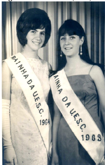
Figura 11: As rainhas (1964)