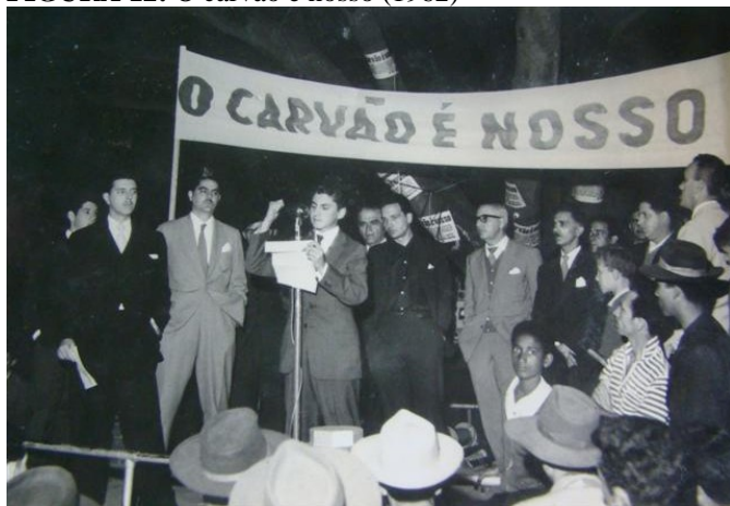
FIGURA 12: O carvão é nosso (1962)