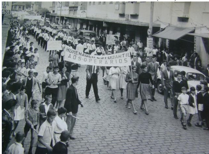
FIGURA 07: Passeata 1º de maio em Criciúma (1962)

é a passeata que comemorou o 1º de maio na cidade em 1962.