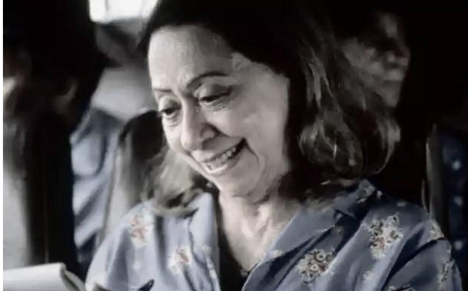
Figura 09: Central do Brasil (1998)