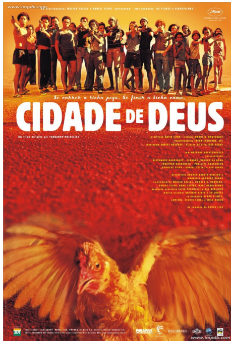
Figura 06: Buscapé (2002)

É preciso estar atento ao currículo e documentos que norteiam a sua escola, mas é possível filtrar as obras por gênero, classificação indicativa, ficha técnica, autores, artistas, trilha sonora e claro, sempre ter o conhecimento de seu conteúdo na íntegra.