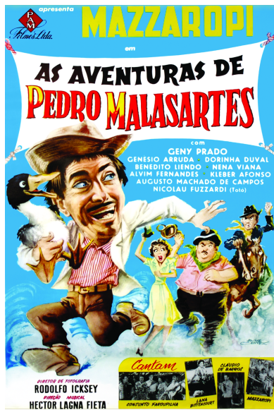
Figura 03: Mazzaropi (1960)