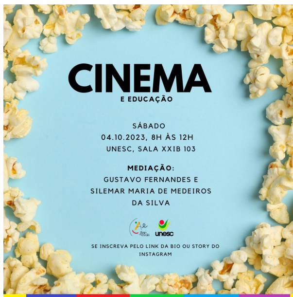
Figura 11: Convite Cinema e Educação