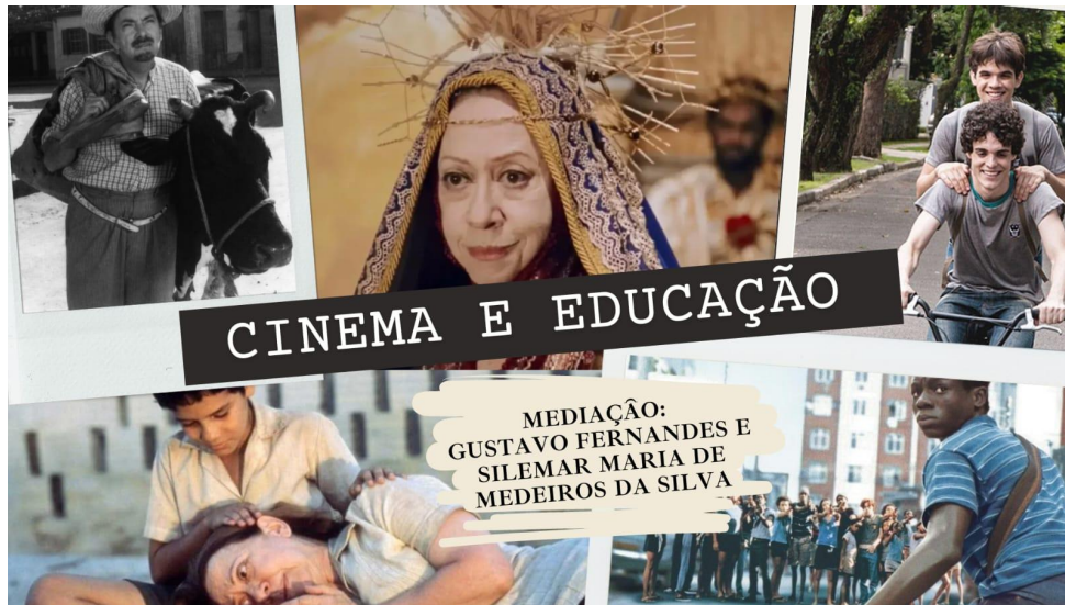
Figura 12: Arte de Apresentação