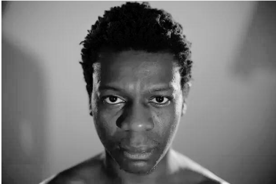
Figura 05: Cidade de Deus (2002)