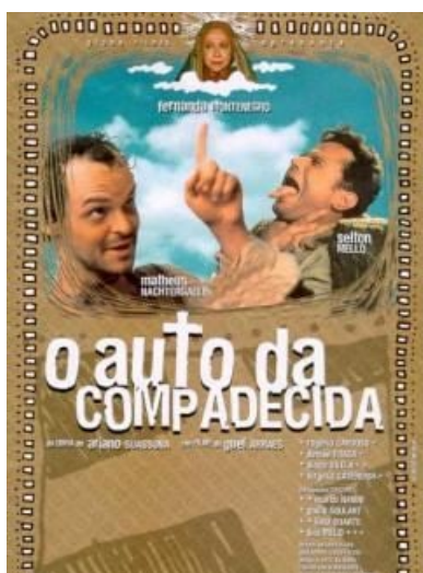
Figura 08: João Grilo (2000)

Portanto, saber do amparo da Lei, para a valorização do Cinema Nacional na escola, é estar ciente dos direitos e deveres ao conceber um planejamento.