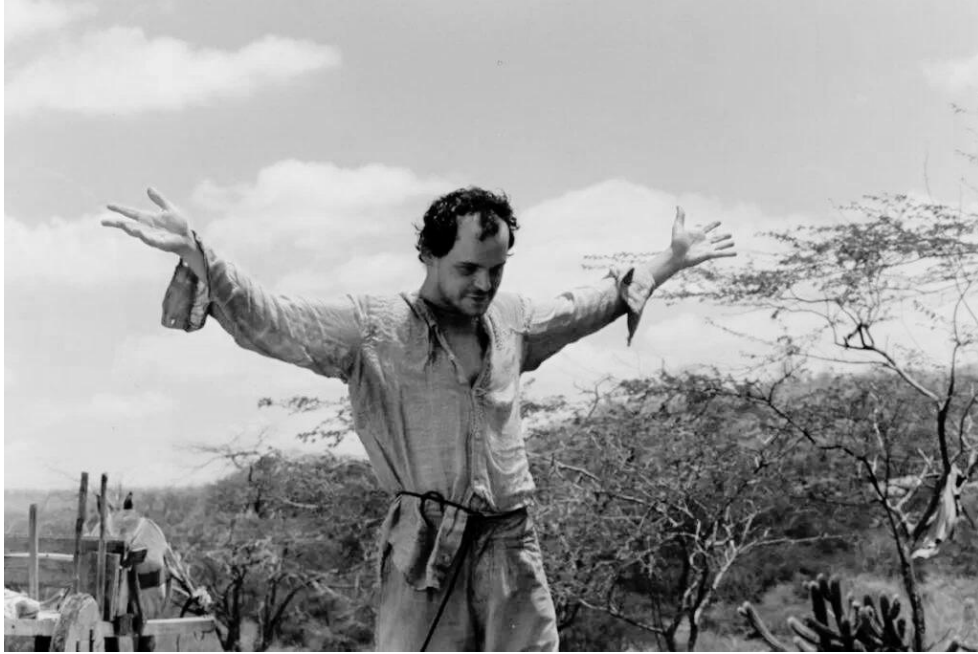
Figura 07: O Auto da Compadecida (2000)