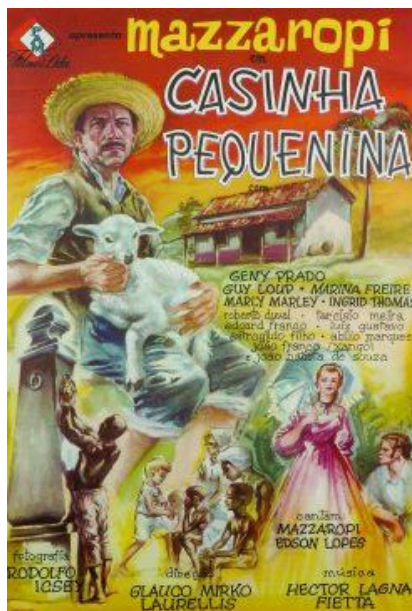
Figura 04: Mazzaropi (1963)

Com este tradicional personagem da cultura portuguesa e brasileira, no filme As Aventuras de Pedro Malasartes de 1960, Mazzaropi traz a sua versão ao interpretar o astuto e atrapalhado Pedro Malasartes. Nesta obra repleta de ilustres personagens, Pedro é enganado pelos seus dois irmãos, que roubam todo o seu dinheiro, tendo assim que começar a aplicar pequenos golpes para sobreviver. Entre as aventuras e desventuras de Pedro Malasartes, é impossível não sorrir e se emocionar com este personagem tão querido da cultura popular.