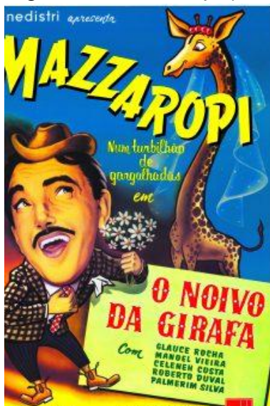
Figura 02: Mazzaropi (1957)

Mas, e os Filmes do Mazzaropi? Aqui aponto como um dos maiores interesses de minha avó, pois a mesma tinha uma coleção de fitas cassete em sua estante de Filmes. O Noivo da Girafa (Victor Lima, 1957), As Aventuras de Pedro Malasartes (Rodolfo Mickey, 1960), e Casinha Pequena (Glauco Mirko Laurelli, 1963) estavam entre as suas produções favoritas, das quais assistimos juntos repetidamente. Amácio Mazzaropi (1912-1981) deixou um lindo e duradouro legado no cenário do Cinema Nacional, com obras que marcaram gerações.