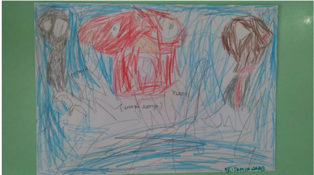
Figura 22 – Liga da justiça