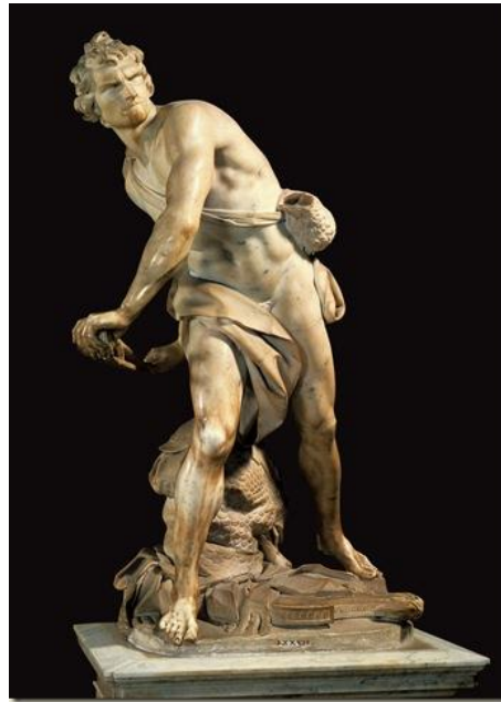
Figura 8– Davi , de Gian Lorenzo Bernini 13