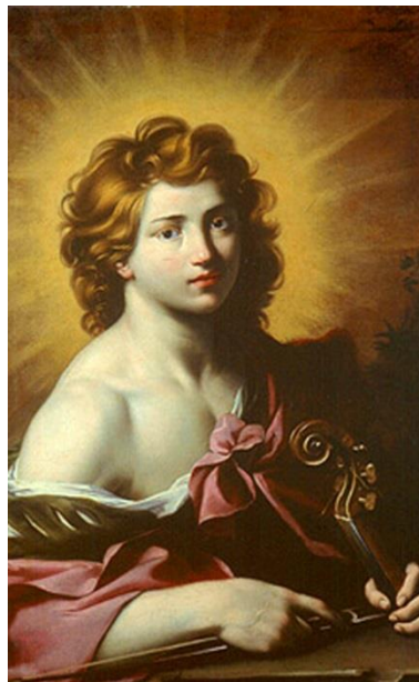
Figura 3 9 - Apolo , representado por Michel de Sobleau, Século XVI