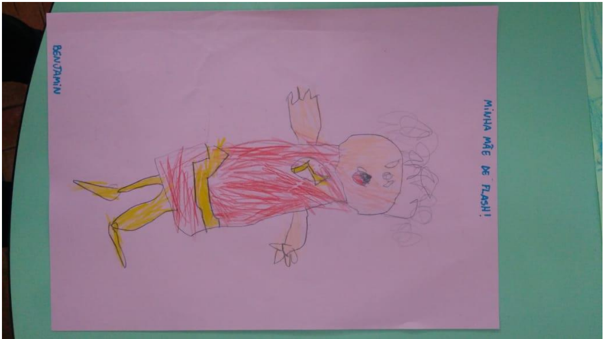
Figura 24 –“Minha mãe de Flash”