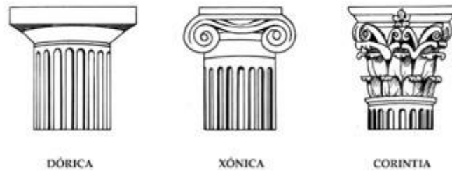
Figura 6 – Colunas Dóricas, Jônicas e Coríntias.