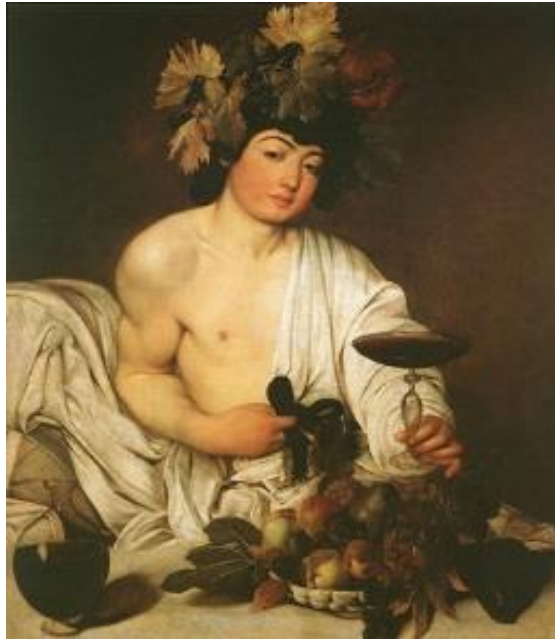
Figura 2 - Baco (Dionísio, para os gregos) 8 , Caravaggio, Século XVI.