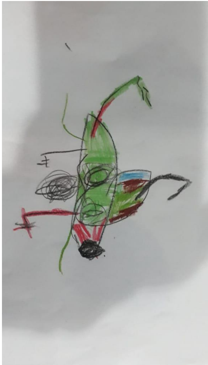
Figura 21 – Personagem Sonic com um chapéu

Fonte: Reprodução autorizada pela autora Ana Claudia Marques (2018)