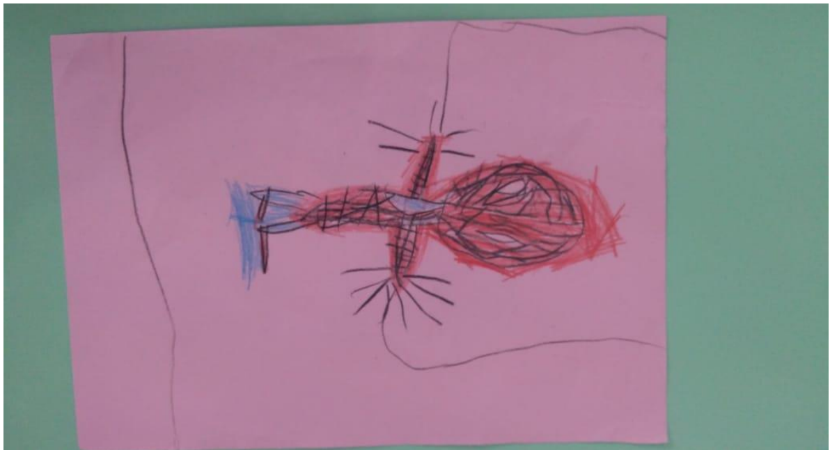
Figura 23 – Homem Aranha

Fonte: Reprodução autorizada pela autora Stéfany Ribeiro (2018)