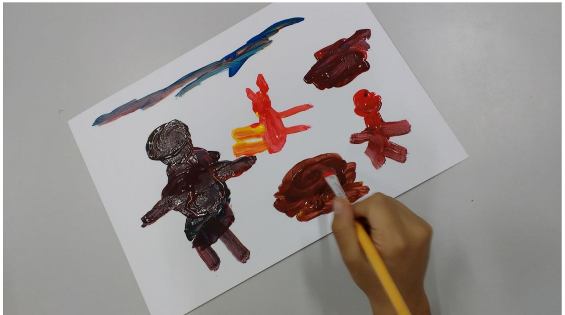
Figura 17 – Desenho Homem Aranha 2

Fonte: Reprodução autorizada pela autora Rita de Cassia Citadin (2017)