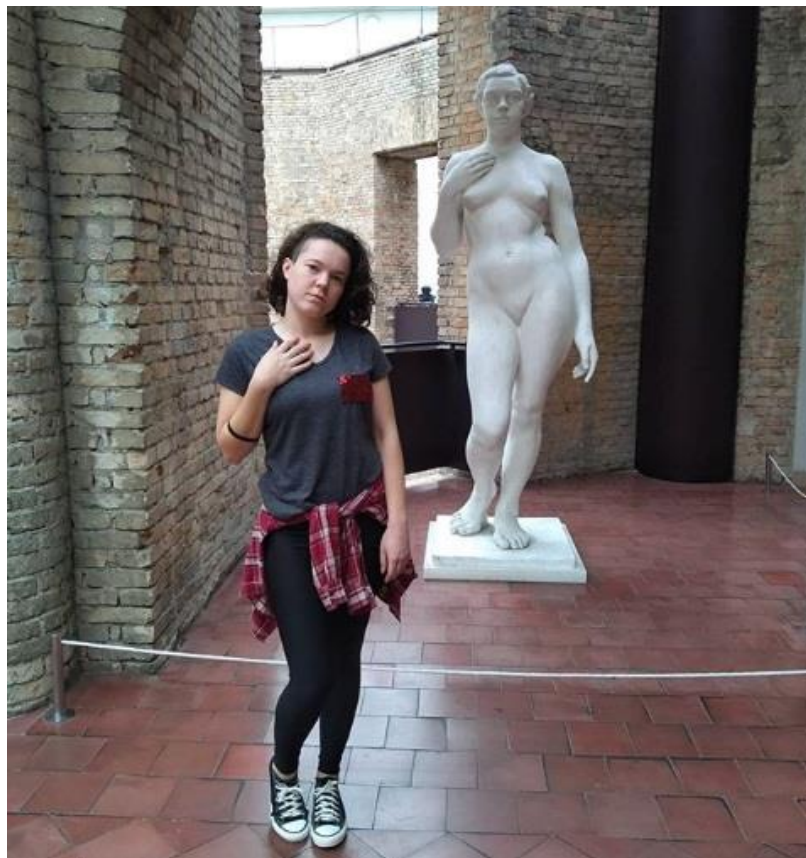
Figura 15 – Imitação de uma estátua da Pinacoteca de São Paulo