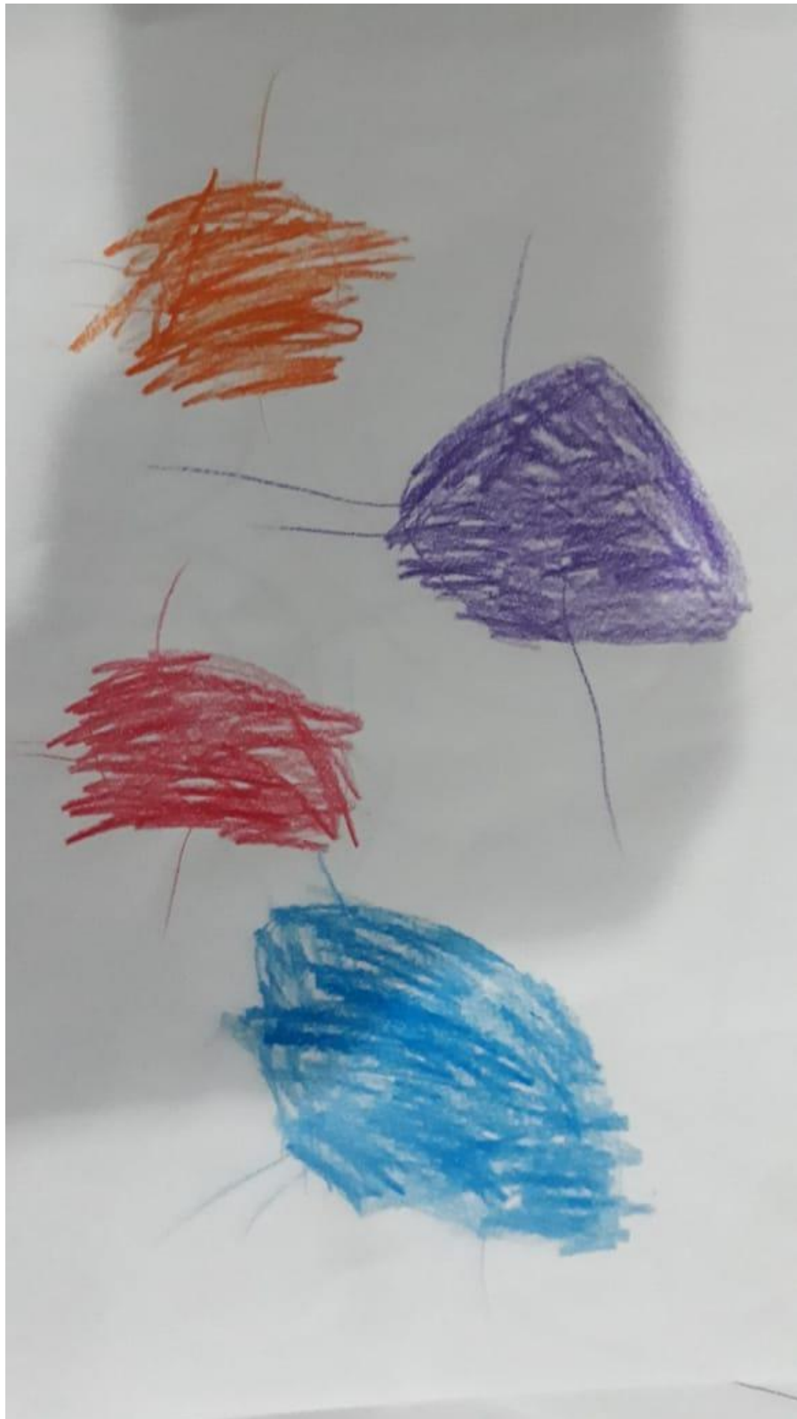
Figura 20 – Tartarugas Ninja

Fonte: Reprodução autorizada pela autora Ana Claudia Marques (2018)