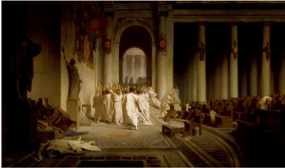
Figura 1 – A morte de César de Jean-Léon Gérôme 4