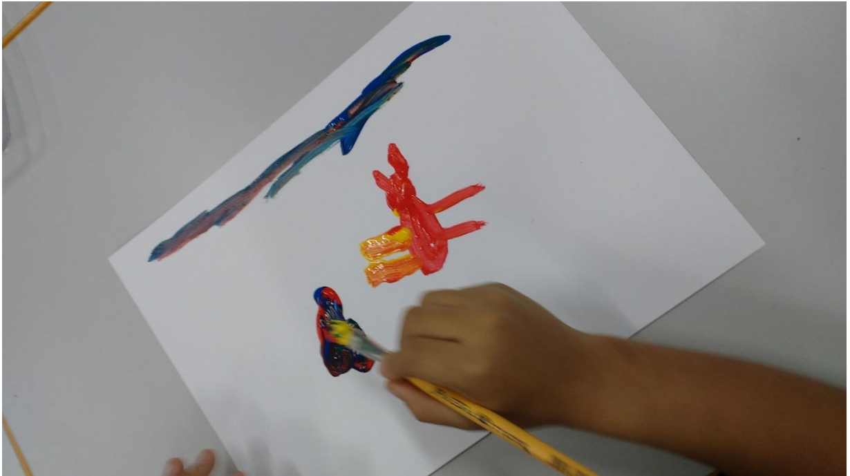
Figura 16 – Desenho Homem Aranha

Fonte: Reprodução autorizada pela autora Rita de Cassia Citadin (2017)