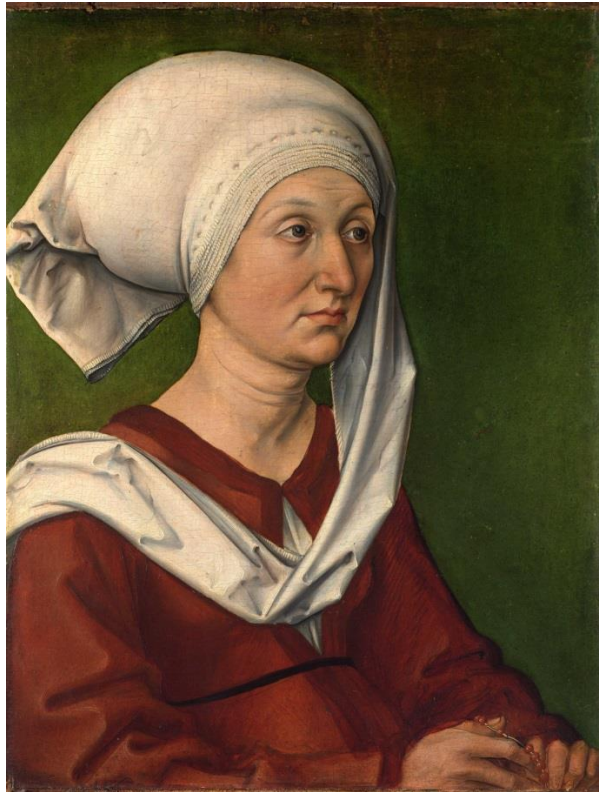
Figura 11 – Retrato de Barbara Durer 15