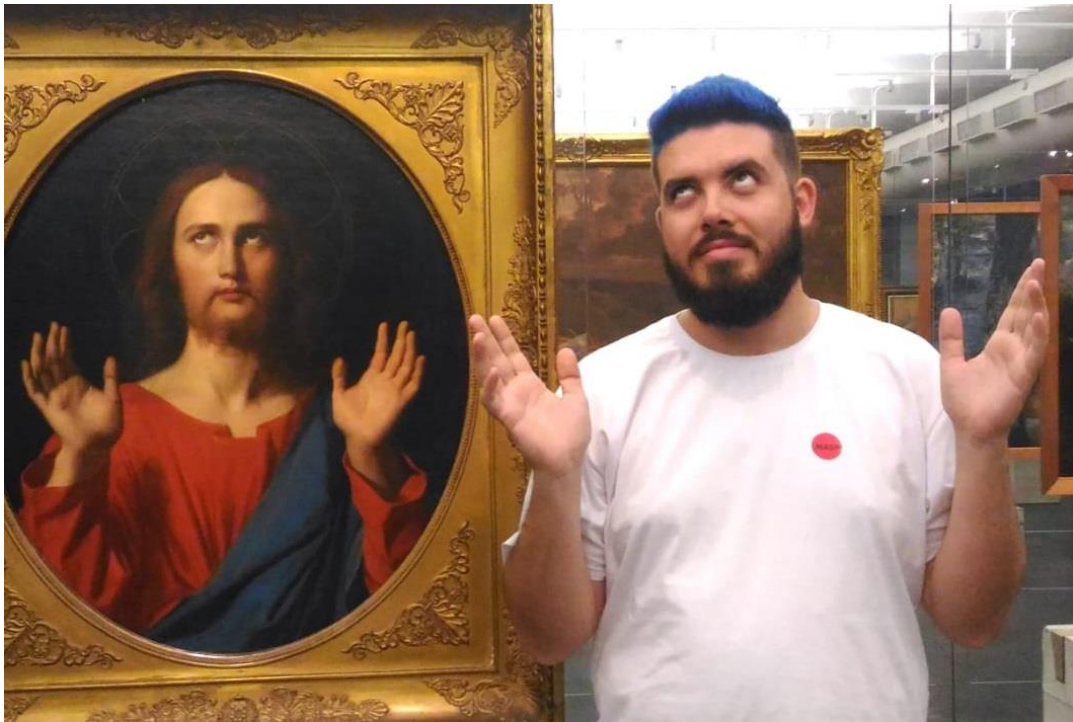
Figura 14 – Imitação da obra Cristo Abençoador de Ingres.

Fonte: Reprodução autorizada pelo autor Isaac Cargnin (2018)