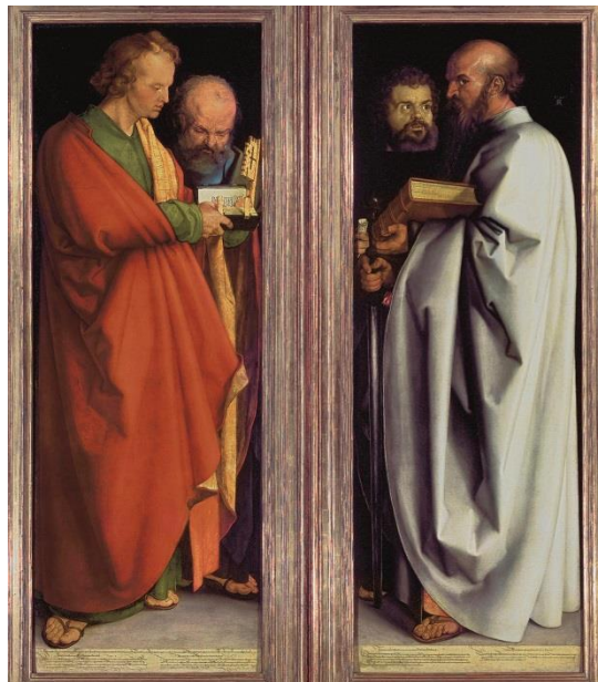
Figura 12 – Quatro apóstolos 16