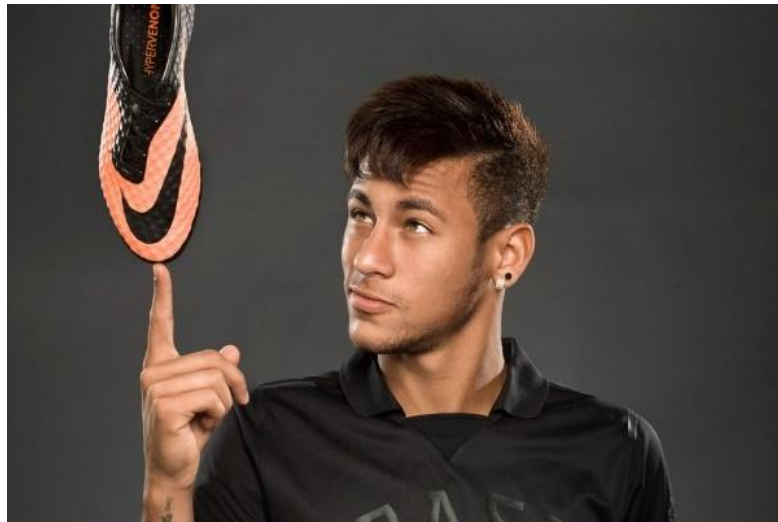
Figura 4 - Material publicitário da marca Nike com o jogador de futebol Neymar Júnior.