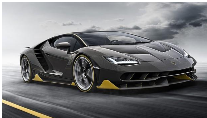
Figura 7 - Lamborghini Centenario

Um automóvel da marca italiana Lamborghini, imediatamente nos remete a algo intenso. Suas linhas são inclinadas e fluídas, como que se estivessem sendo agitadas ao vento. Sua carroceria é cheia de entradas de ar feitas por ângulos pontudos, com um visual geral agressivo. É quase como se o carro estivesse andando mesmo parado. Ou como se fosse uma obra que precisa expressar esse drama, essa teatralidade.