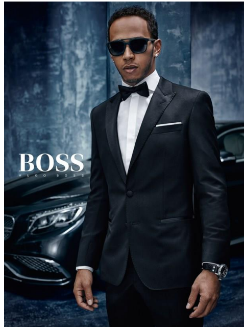
Figura 5 – Material publicitário da marca Hugo Boss com o piloto de Fórmula 1 Lewis Hamilton