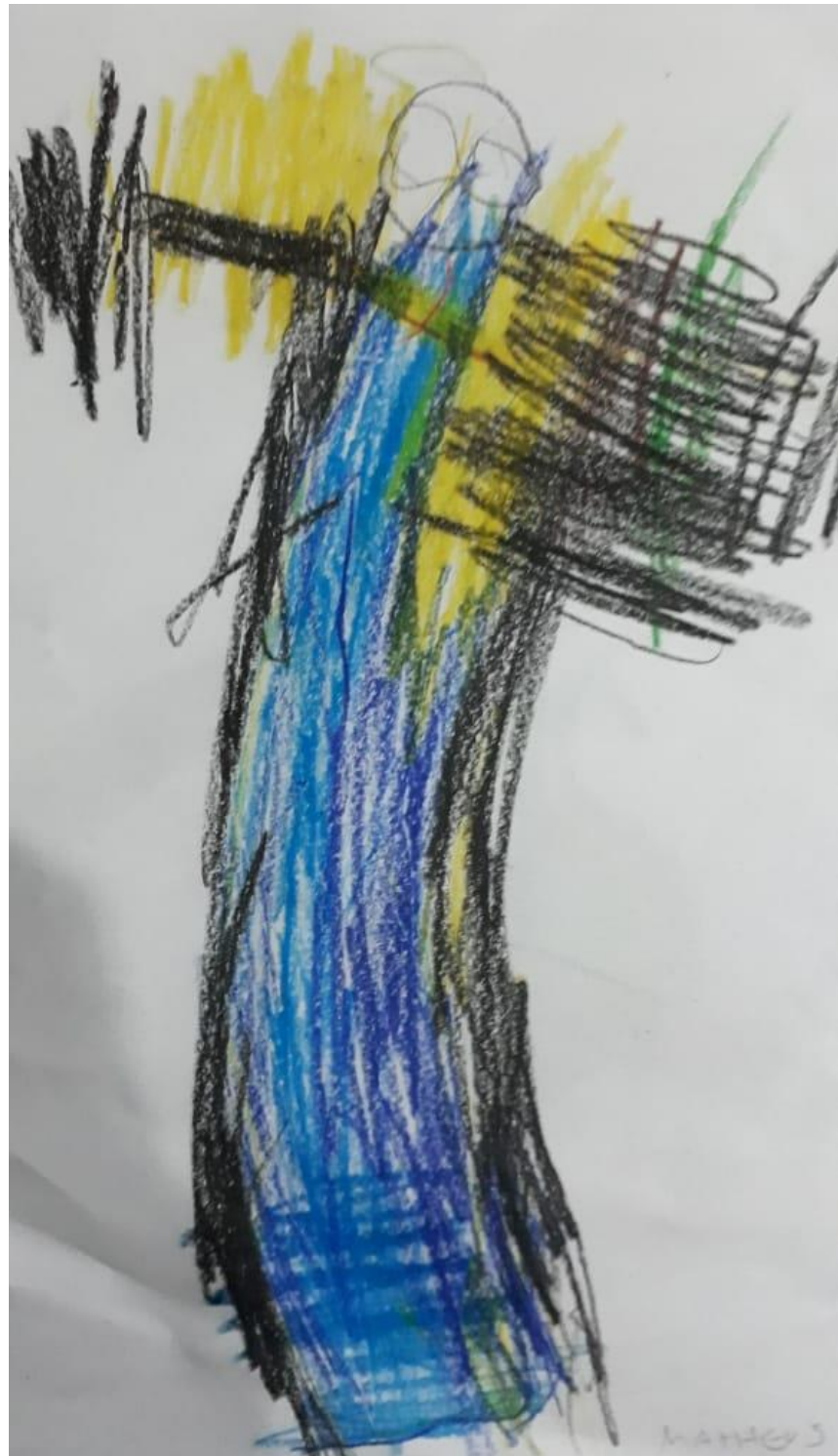
Figura 19 – Super Homem