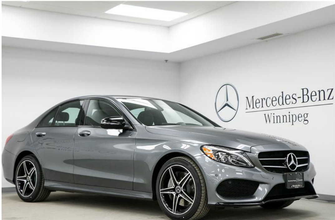
Figura 10 – Mercedes C 300