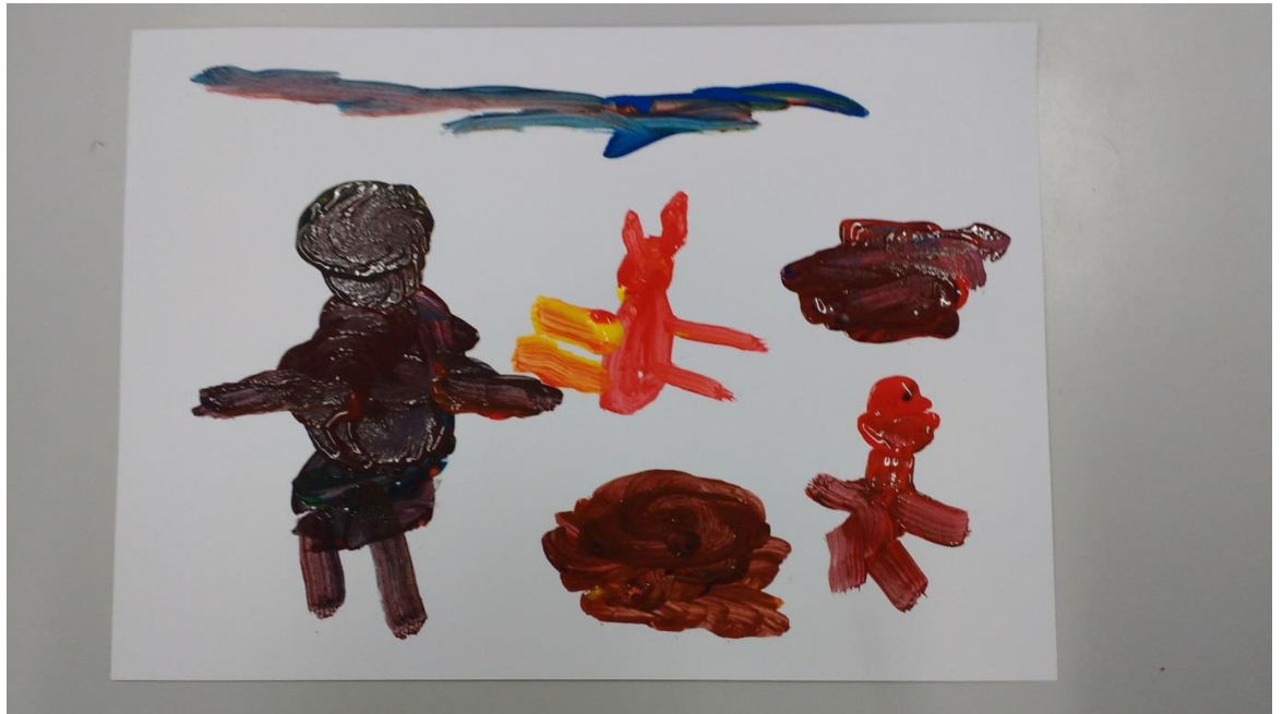
Figura 18 – Desenho Homem Aranha 3

Fonte: Reprodução autorizada pela autora Rita de Cassia Citadin (2017)