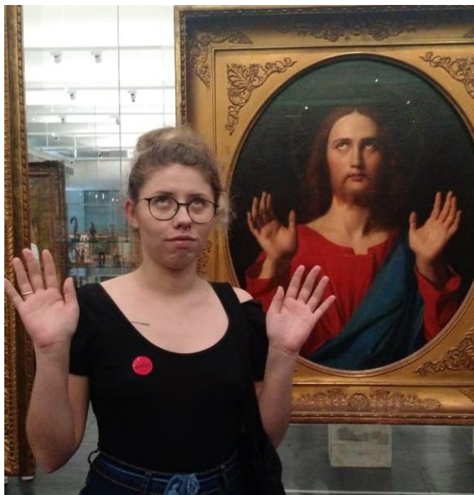
Figura 13 – Imitação da obra Cristo Abençoador de Ingres.